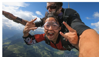
skydive-switzerland-sprung-sommer