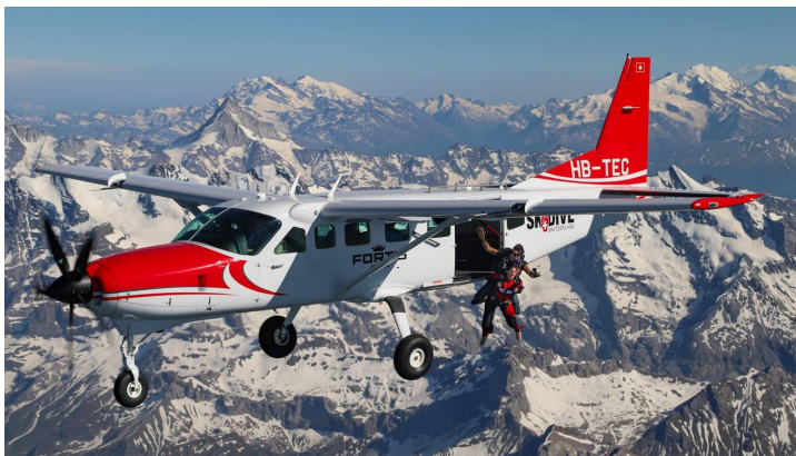
skydive-switzerland-flugzeug