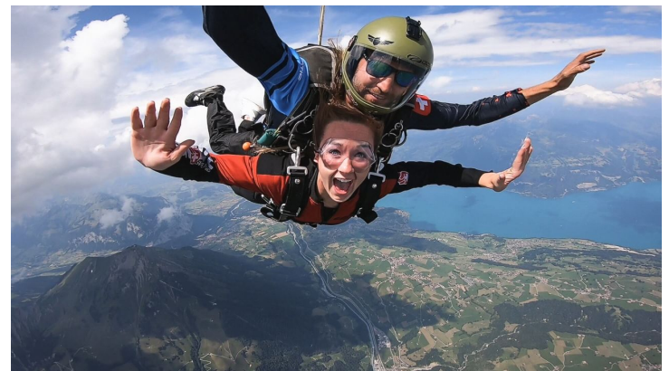
skydive-switzerland-sprung-sommer-thunersee