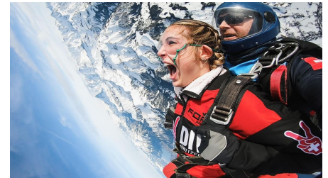
skydive-switzerland-sprung-winter-upside-down