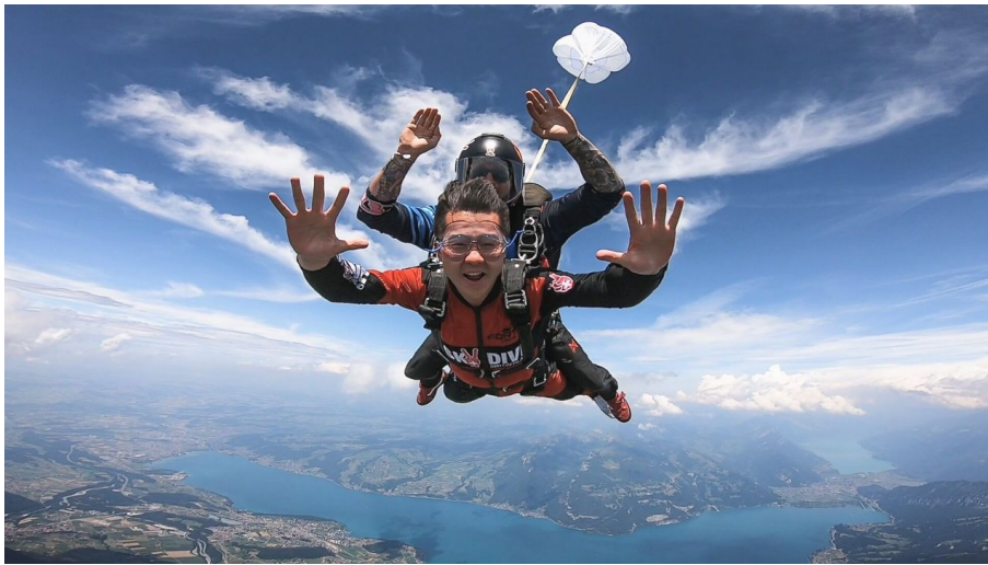
skydive-switzerland-sommer-sprung