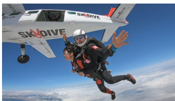
skydive-switzerland-sprung-flugzeug-wolken