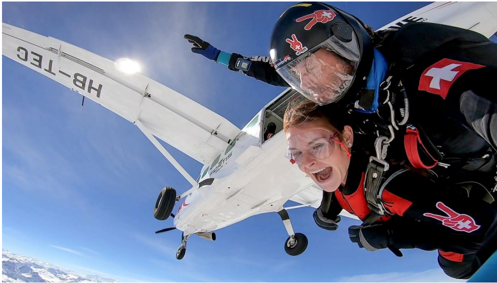
skydive-switzerland-sprung-flugzeug