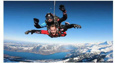
skydive-switzerland-winter-panorama