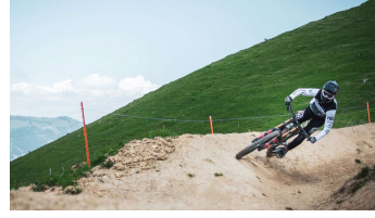
downhill-bikepark-wirihorn-biker-auf-talfahrt- wiese-kurve.jpg