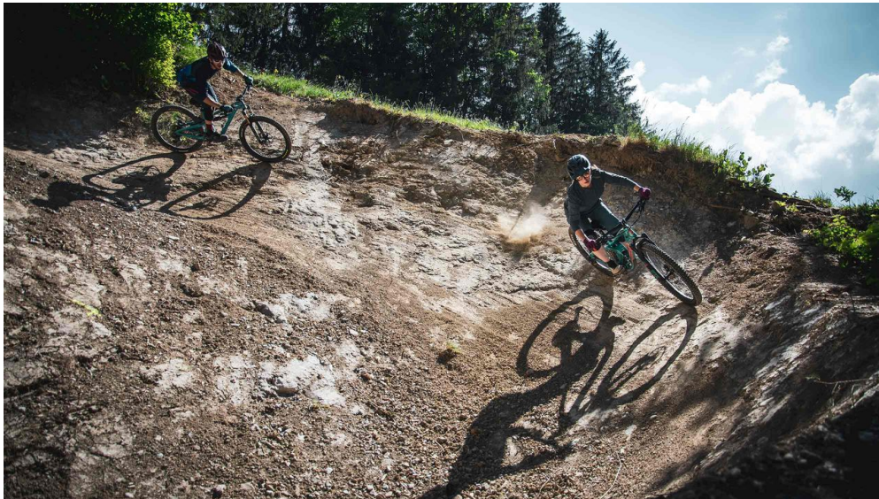
downhill-bikepark-wirihorn-steilwandkurve-mit-bikern.jpg

_____ Mai – Juni Wochenendbetrieb / Juli – Mitte Oktober täglicher Betrieb / Mitte Oktober bis Wintereinbruch Wochenendbetrieb Der Betrieb der Wirihornbahnen wird jeweils der Witterung angepasst * Information: www.wirihorn.ch , oder Infotelefon +41 33 684 12 33 * Spezialfahrten für Gruppen auf Reservation