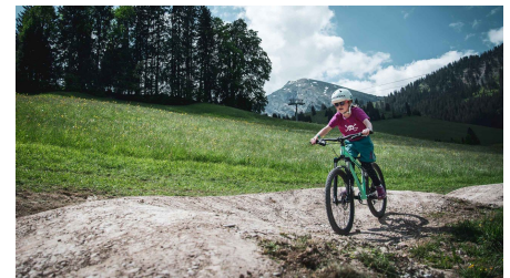
downhill-bikepark-wirihorn-pumptrack-kind.jpg