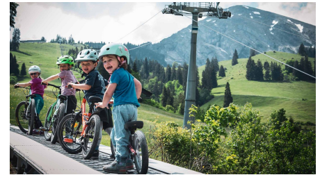
downhill-bikepark-wirihorn-kinder-auf-transportband.jpg