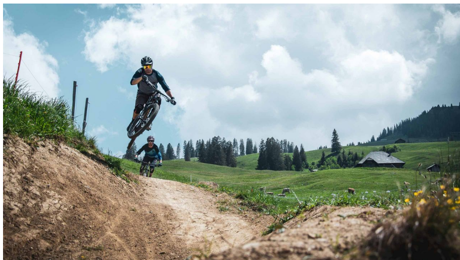
downhill-bikepark-wiriehorn-biker-springen-ins-bild.jpg - - web@interlaketourism.ch