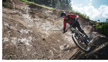
downhill-bikepark-wirihorn-biker-in- steilwandkurve.jpg