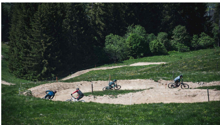
downhill-bikepark-wirihorn-abfahrt-richtung-tal.jpg