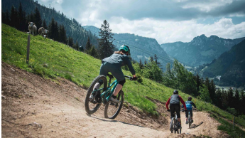
downhill-bikepark-wirihorn-biker-fahren- richtung-tal.jpg