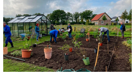
Pflanzung historischer Rosen 02.10.2021.jpg