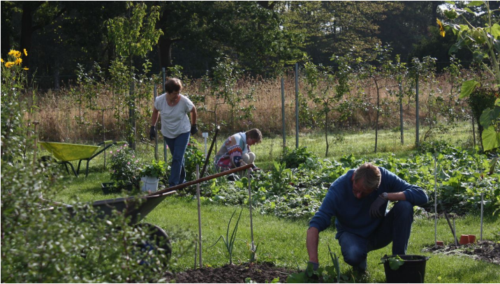
IMG_1103 Es gibt immer etwas zu tun.JPG