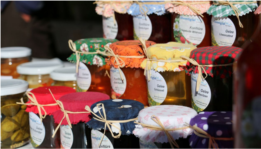
Selbstgemachte Konfis und Gelee aus dem Burelädeli