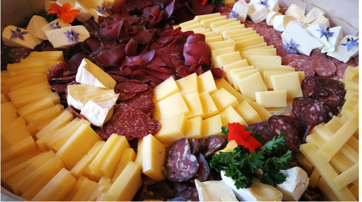
Fleisch- und Käseplatten können beim Buurelädeli bestellt werden - © Naturpark Diemtigtal

Quelle: destination.one ID: p_100043210 Zuletzt geändert am 15.03.2024, 13:55