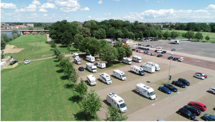
kanzlers weide_5.JPG

Die Eintrittspreise bei Veranstaltungen variieren.