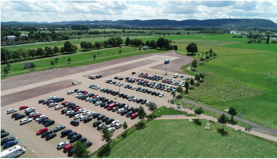
kanzlers weide_4.JPG