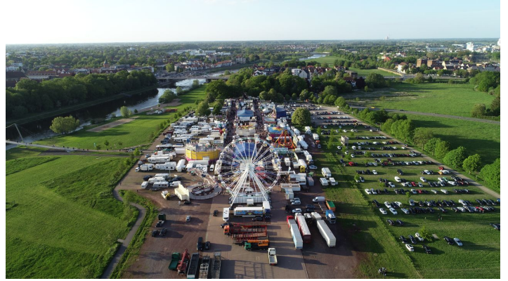
kanzlers weide_1.JPG