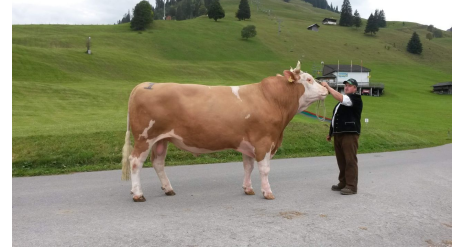
Bauer mit Muni