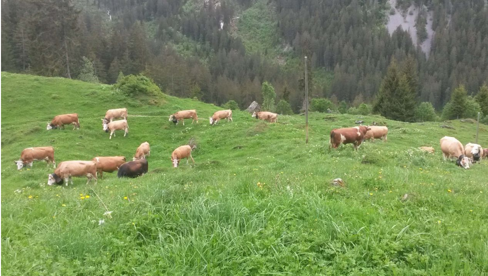
weidende Kühe