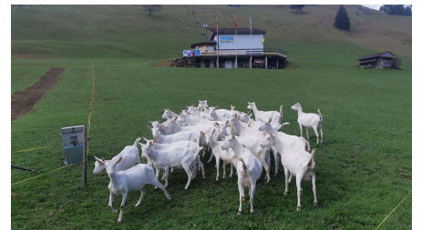
weisse Ziegen