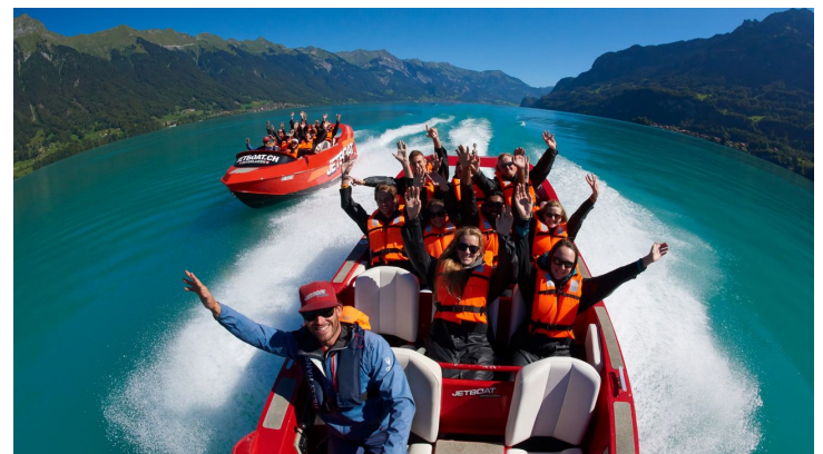
jetboat-brienzersee-sommer-inside-wasseraktivitaeten-action-fun-boot-pedalo