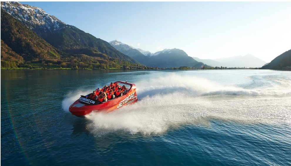
jetboat-fruehling-turn-brienzersee-wasseraktivitaeten

Sommerbetrieb April – Oktober Winterbetrieb November – März