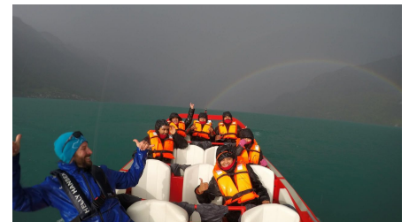
jetboat-regenwetter-asien-brienzersee-regenwettertipps