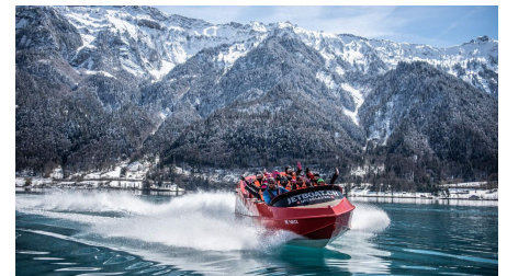
jetboat-winter-brienzersee-schnee-berge.jpg