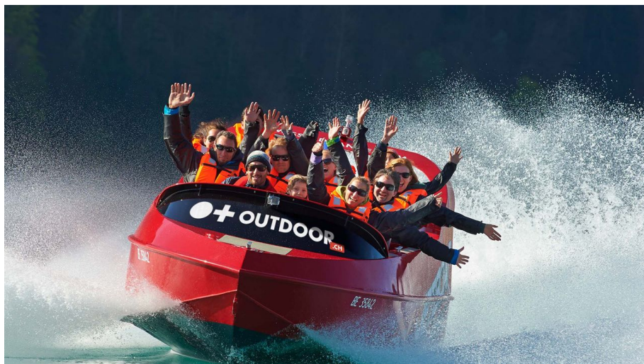
Jetboat Interlaken fun soft adventure.jpg

Schifffahrt Jetboat Führungen Videos Sommer