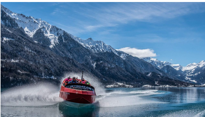
jetboat-winter-brienzersee-schnee.jpg