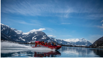
jetboat-winter-brienzersee-niesen-schnee.jpg