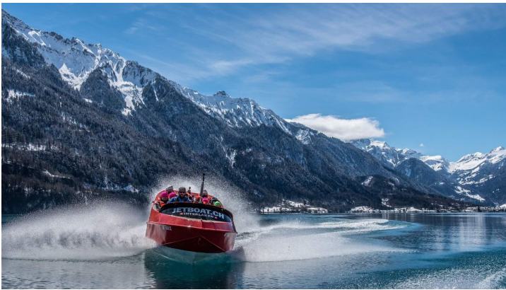
Jetboat Interlaken