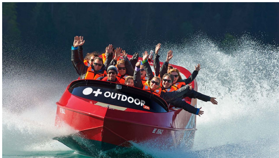
Outdoor Switzerland, Interlaken Tourismus - web@interlaketourism.ch