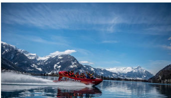
Jetboat Interlaken / Outdoor Switzerland AG, Interlaken Tourismus - web@interlaktourism.ch