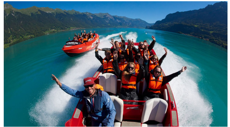
Jetboat Interlaken / Outdoor Switzerland AG, Interlaken Tourismus - web@interlaktourism.ch