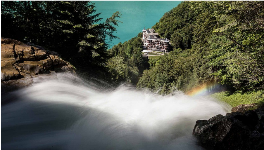
brienz-giessbach-wasserfaelle-ausblick