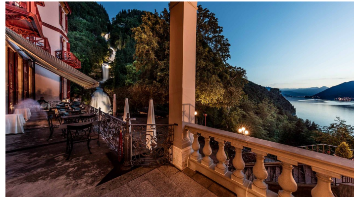
brienzi-giessbach-wasserfaelle-grandhotel-terrasse