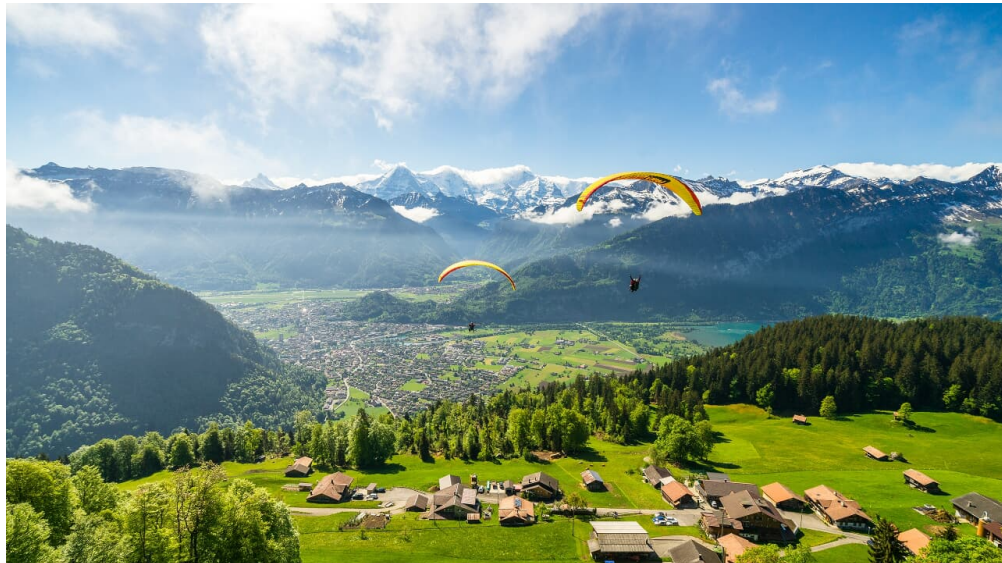
paragliding-interlaken-sommer-beatenberg-sonnenschein