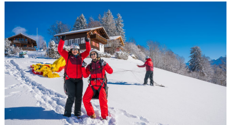
paragliding-interlaken-winter-schnee-sonnenschein