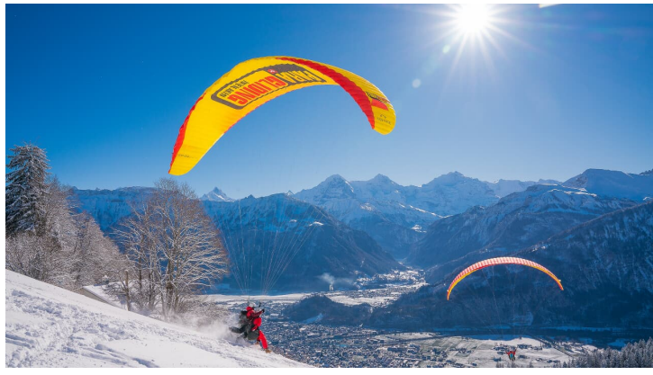
paragliding-interlaken-berge-winter-schnee