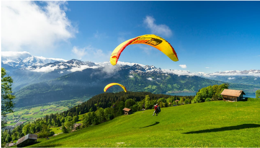
paragliding-interlaken-sommer-berge-panorama-sonnenschein