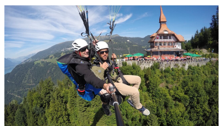
paragliding-interlaken-harder-kulm-sommer