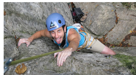
Swiss Alpine Guides