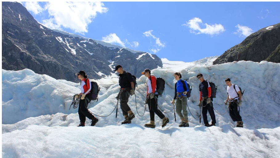
Swiss Alpine Guides, Interlaken Tourismus - web@interlaketourism.ch