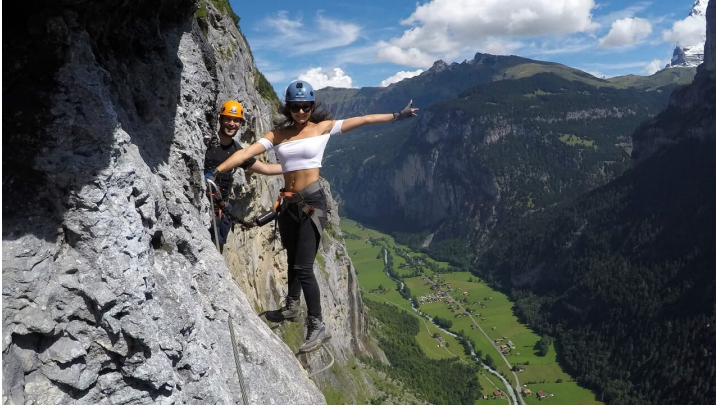
Swiss Alpine Guides, Interlaken Tourismus - web@interlaketourism.ch