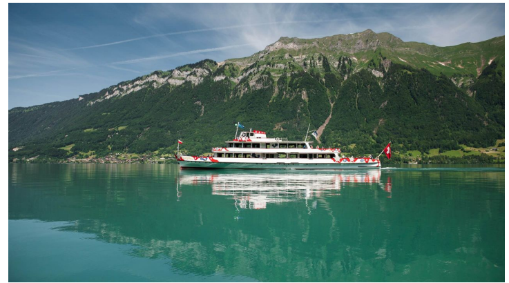
brienzersee-schiffahrt-sommer-msjungfrau-niederried