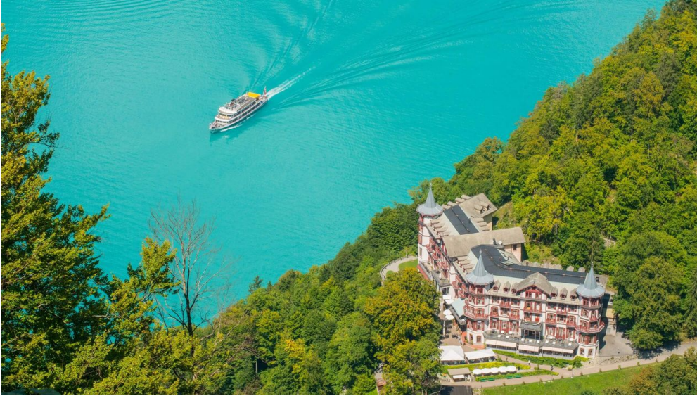
brienzersee-schiffahrt-sommer-giessbach-hotel-wald