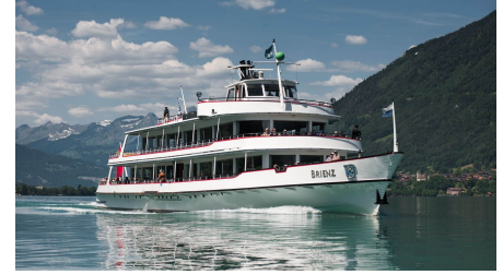
brienzersee-schiffahrt-sommer-msbrien