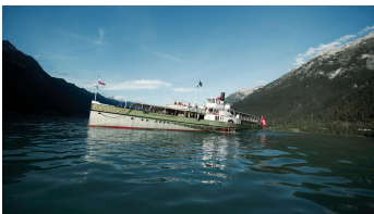
brienzersee-schiffahrt-sommer-loetschberg-dampfschiff