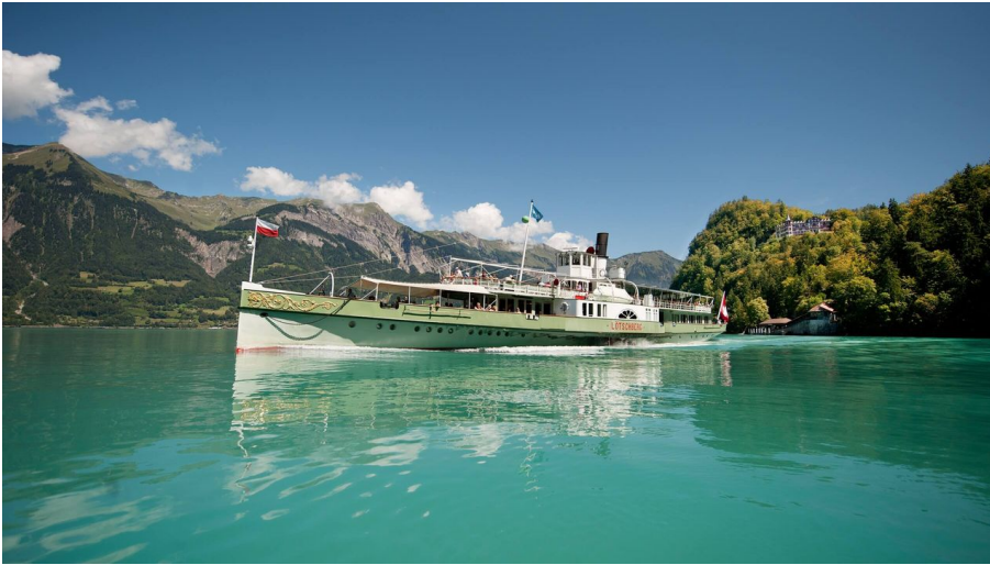
brienersee-schifffahrt-sommer-loetschberg-dampfschiff-giessbach