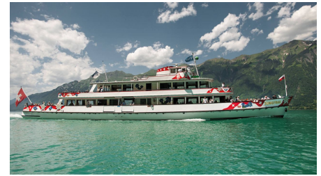
brienzersee-schiffahrt-sommer-jungfrau