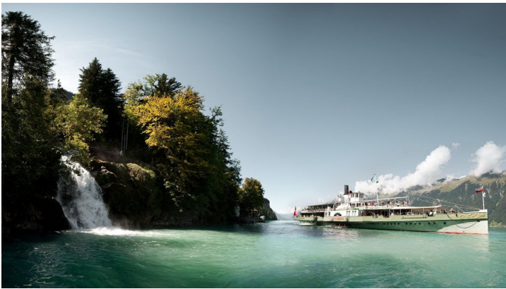
brienzersee-ts-schiffahrt-sommer-loetschberg-dampfschiff-giessbachfaelle