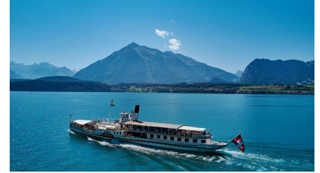
thunersee-schiffahrt-bluemlisalp-sommer-niesen.jpg