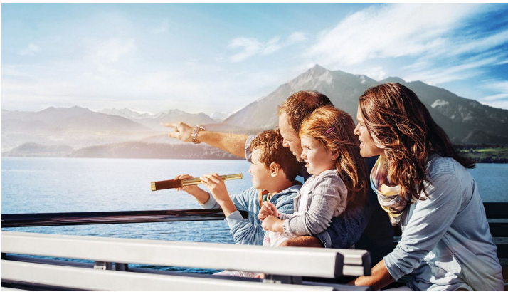
thunersee-schiffahrt-familie-sommer-aussicht