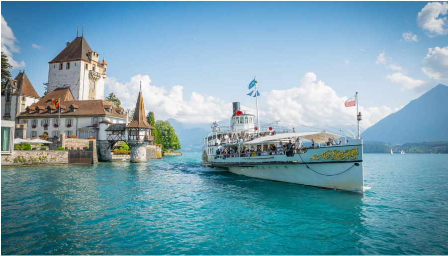
oberhofen-schloss-schiff-bluemlisalp-sommer-dampfschiff-niesen