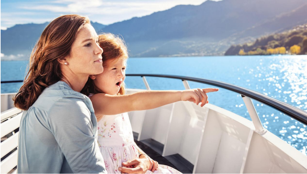
thunersee-schiffahrt-mutter-tochter-sommer-aussicht