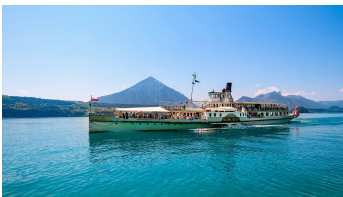
thunersee-schiffahrt-sommer-bluemlisalp-niesen.jpg