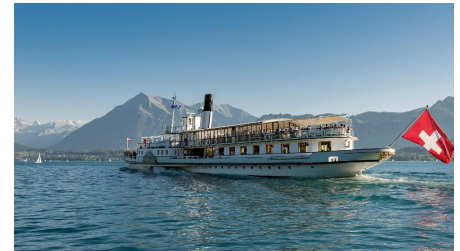
thunersee-schiffahrt-bluemlisalp-sommer-niesen