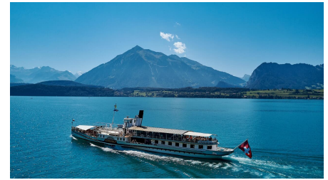
thunersee-schiffahrt-bluemlisalp-sommer-niesen.jpg