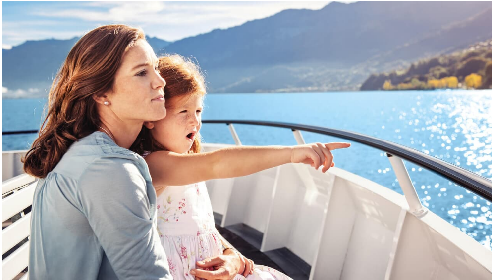
thunersee-schiffahrt-mutter-tochter-sommer-aussicht