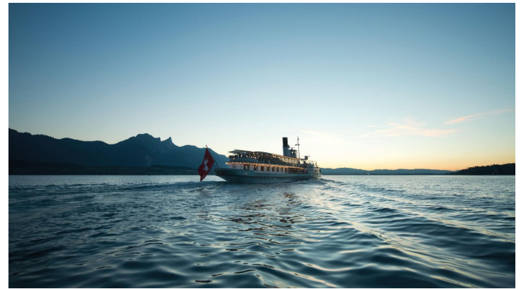
thunersee-schiffahrt-bluemlisalp-sommer-sonnenuntergang