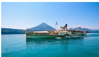
thunersee-schiffahrt-sommer-bluemlisalp-niesen.jpg