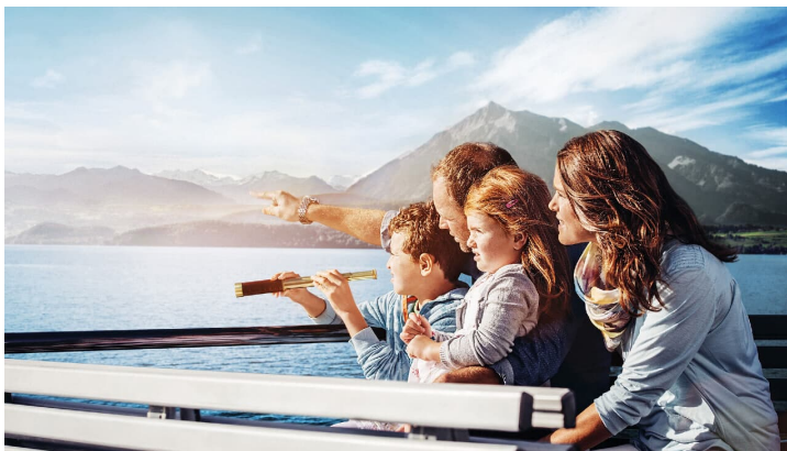
thunersee-schiffahrt-familie-sommer-aussicht