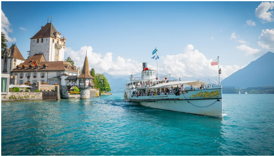
oberhofen-schloss-schiff-bluemlisalp-sommer-dampfschiff-niesen