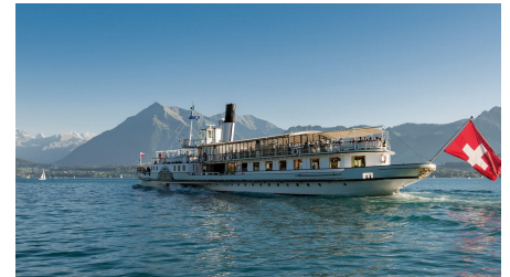
thunersee-schiffahrt-bluemlisalp-sommer-niesen