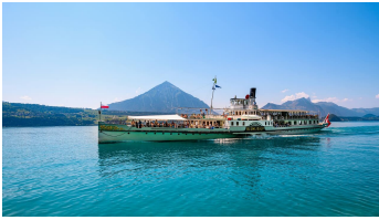
BLS Schifffahrt AG, Interlaken Tourismus - web@interlaketourism.ch