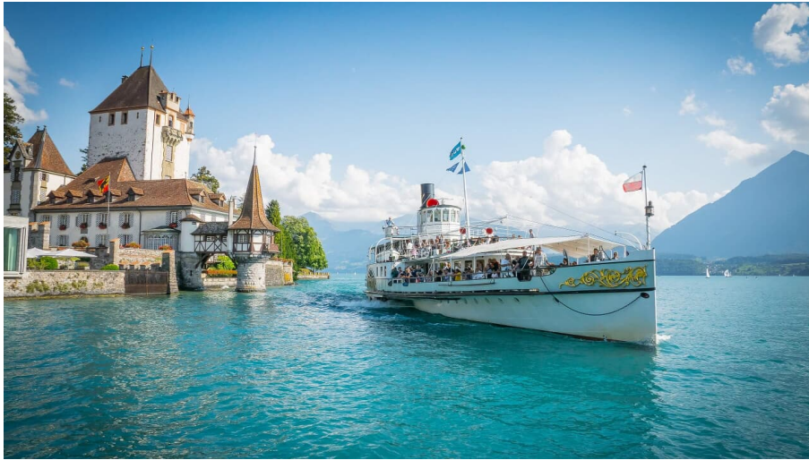
Tourismus-Organisation Interlaken, Interlaken Tourismus - web@interlaketourism.ch