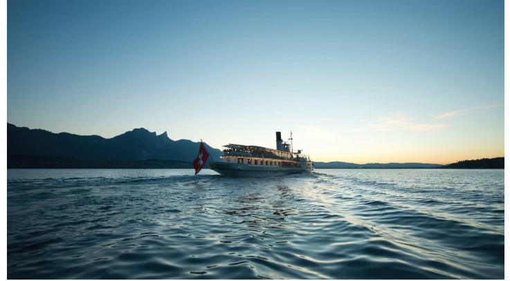
BLS AG, Schifffahrt - web@interlaketourism.ch