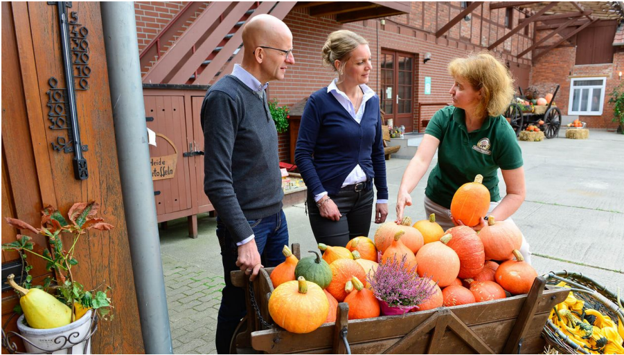
Beratung im Hofladen