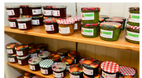
Marmelade im Hofladen