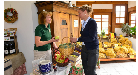
Obstverkauf im Hofladen