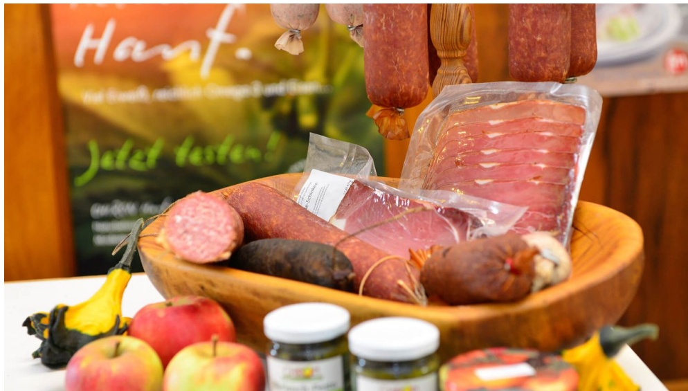
Fleischprodukte im Hofladen