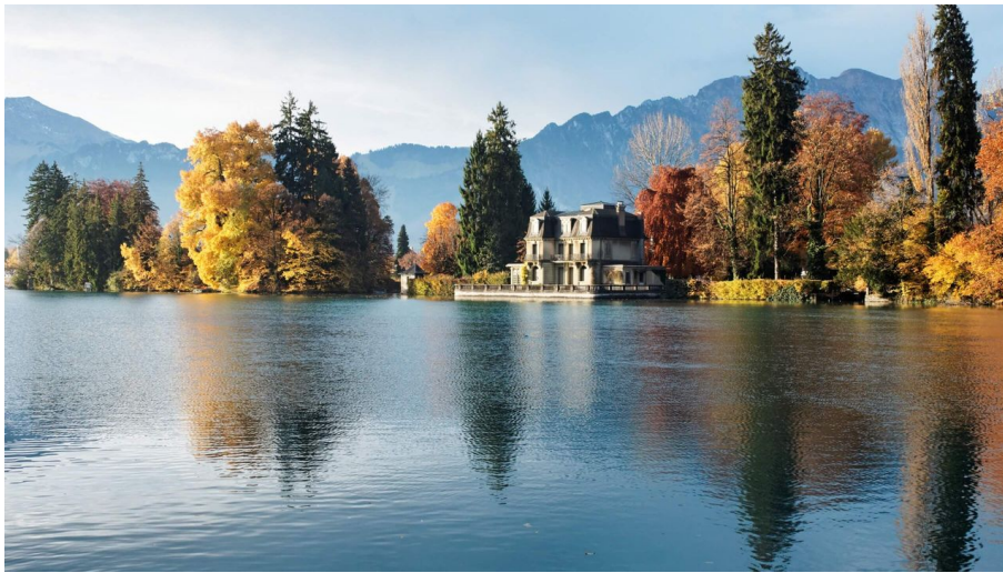
thun-aare-herbst-aarequai-aussicht