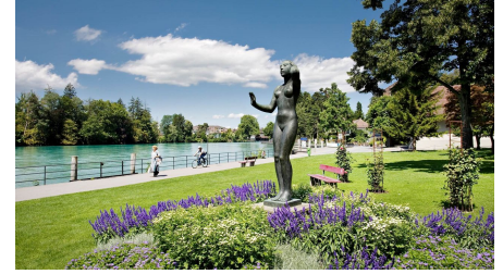
thun-brahmsquai-brahmsstatue