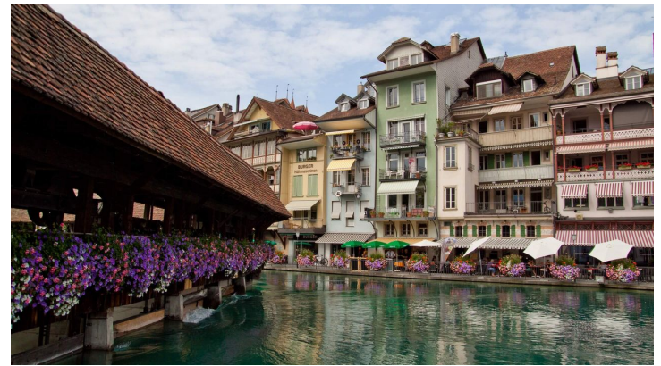
thun-altstadt-sommer-aare-schleuse