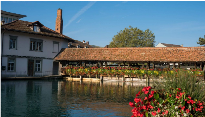
thun-aare-sommer-untere-schleuse-alte-oele