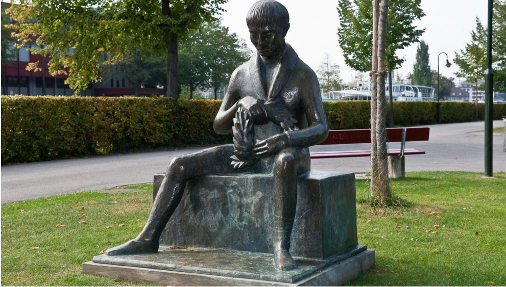
thun-kleist-denkmal