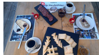
Alp Heubühlen