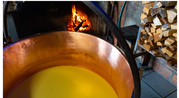
Alp Heubühlen