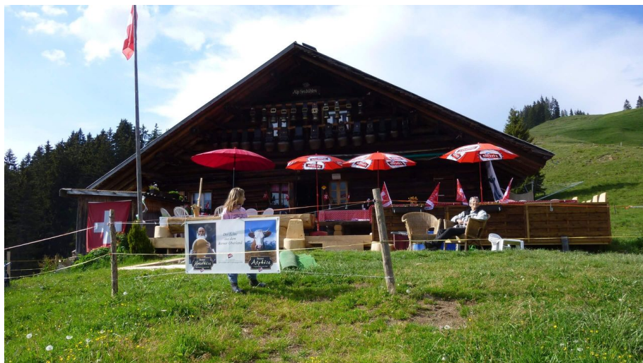
Alp Heubühlen