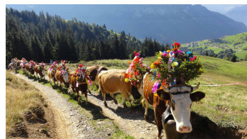
Alp Heubühlen