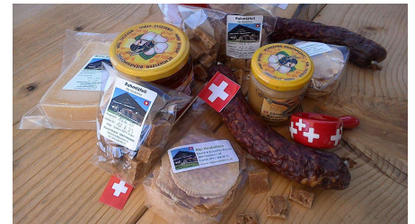
Alp Heubühlen, Interlaken Tourismus - web@interlaketourism.ch