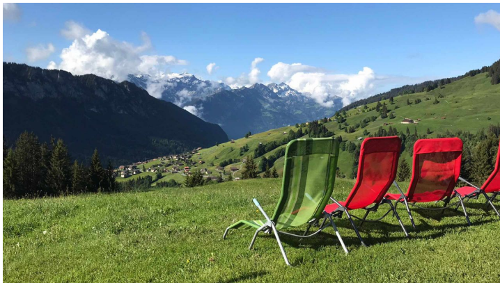
Alp Heubühlen