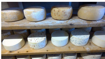
Alp Heubühlen