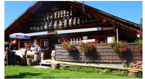
Alp Heubühlen