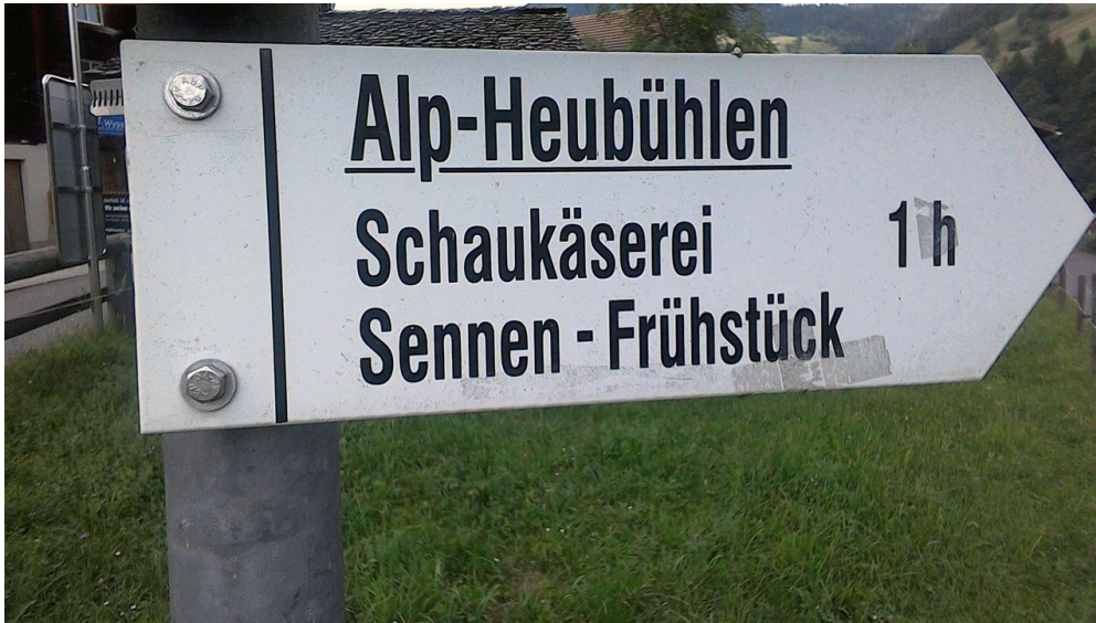
Alp Heubühlen