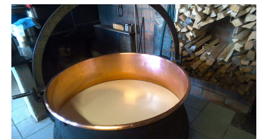
Alp Heubühlen