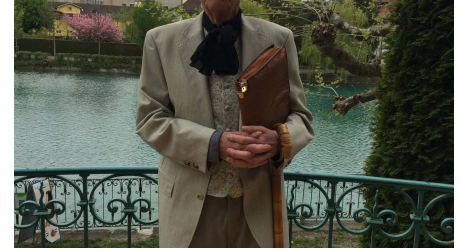
thun-stadtfuehrung-graf-esterhazy