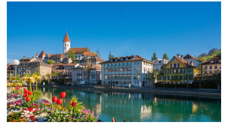
thun-aare-fruehling-blumen-schloss-kirche-spazier-uferwege