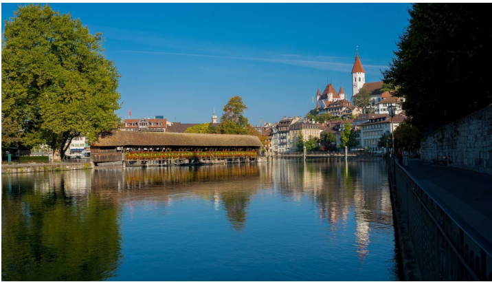
thun-aare-herbst-aare-schleuse-schloss-kirche