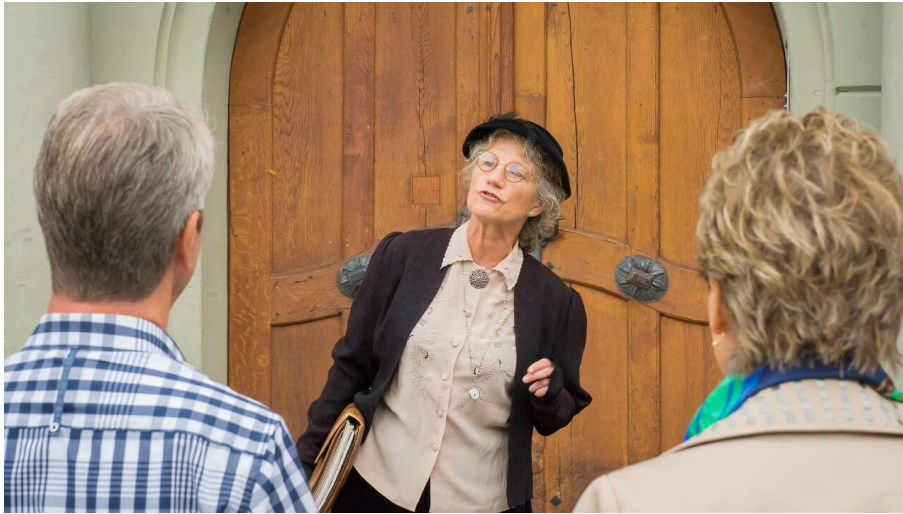
thun-stadtfuehrungen-sommer-rathausplatz-maennerraume-fraentraeume-schule