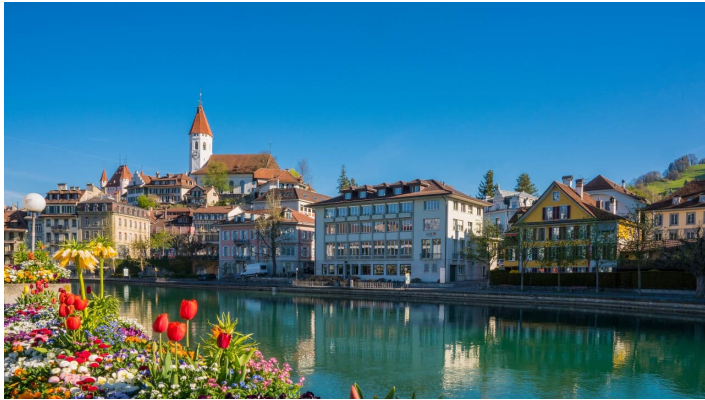
thun-aare-fruehling-blumen-schloss-kirche-spazier-uferwege