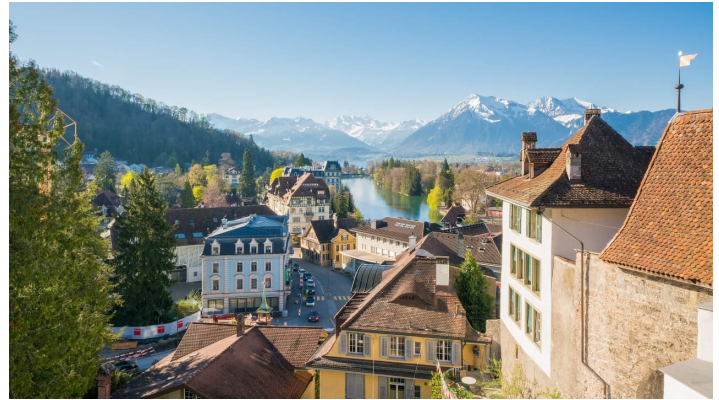
thun-schlossberg-fruehling-aussicht-aare-thunersee-niesen