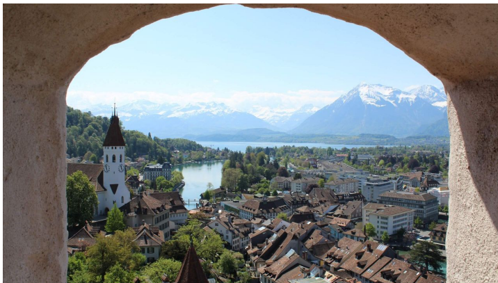
thun-schloss-fruehling-aussicht-westturm