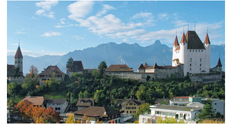
thun-schloss-herbst-panorama-schlossfuehrung-thunerseeschloesser