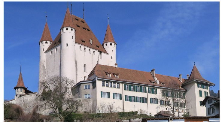
thun-schloss-fruehling-schlossfuehrung