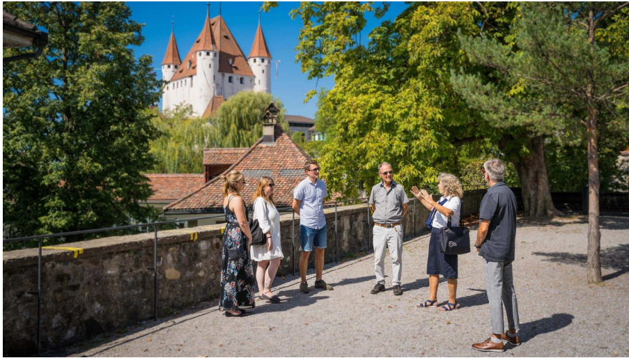
stadtfuehrung-schloss-thun-gruppe-sommer-baeume.jpg