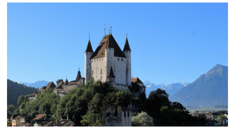
thun-schloss-sommer-niesen-schlossberg