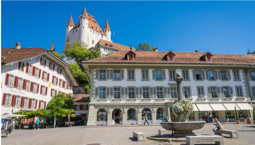
thun-schloss-rathausplatz-brunnen-sommer.jpg

Gruppenbuchungen sind ab 10 Personen ausschliesslich per Rechnung zahlbar. Bei der Schlossführung wird eine zusätzliche Rechnungspauschale von CHF 5.- pro Führung verrechnet.