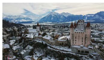
schloss-thun-winter-lufbild-thunersee.jpg