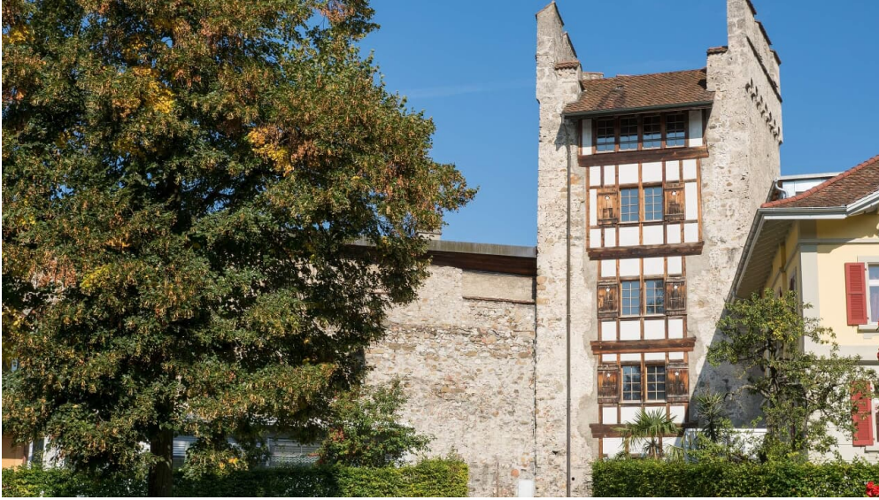
thun-sommer-zyroturm-versteckte-schaetze