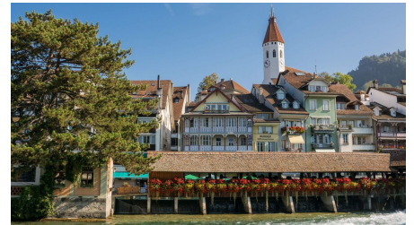
thun-aare-sommer-untere-schleuse-kirche