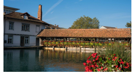
thun-aare-sommer-untere-schleuse-alte-oele