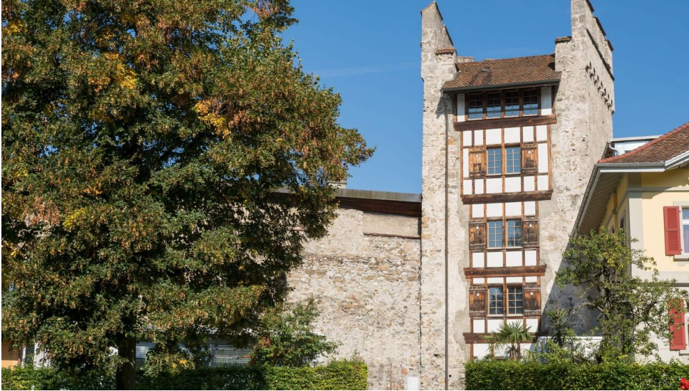
thun-sommer-zyroturm-versteckte-schaetze