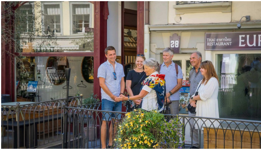
stadtfuehrung-hochrottoir-gruppe-blumen-flanieren.jpg