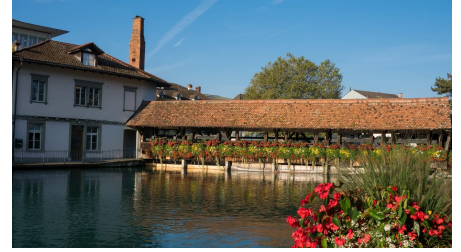
thun-aare-sommer-untere-schleuse-alte-oele