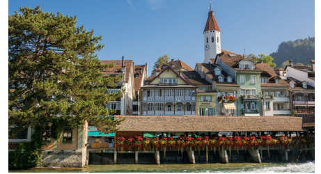
thun-aare-sommer-untere-schleuse-kirche