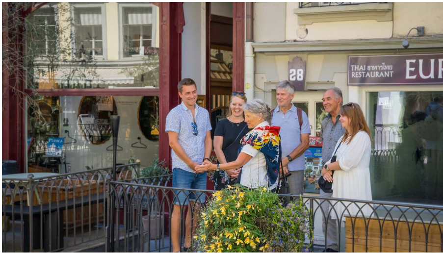
stadtfuehrung-hochrottoir-gruppe-blumen-flanieren.jpg