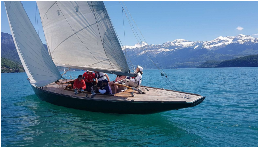
Segelschule Thunersee, Interlaken Tourismus - web@interlaketourism.ch