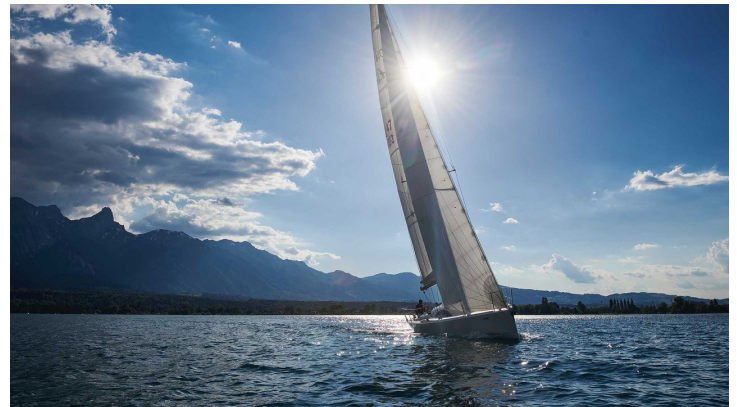
Segelschule Thunersee