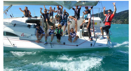
Segelschule Thunersee, Interlaken Tourismus - web@interlaktourism.ch