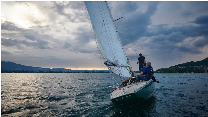
Segelschule Thunersee, Interlaken Tourismus - web@interlaktourism.ch