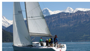
Segelschule Thunersee, Interlaken Tourismus - web@interlaktourism.ch