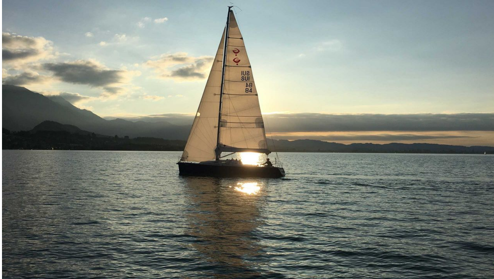
Segelschule Thunersee, Interlaken Tourismus - web@interlaktourism.ch