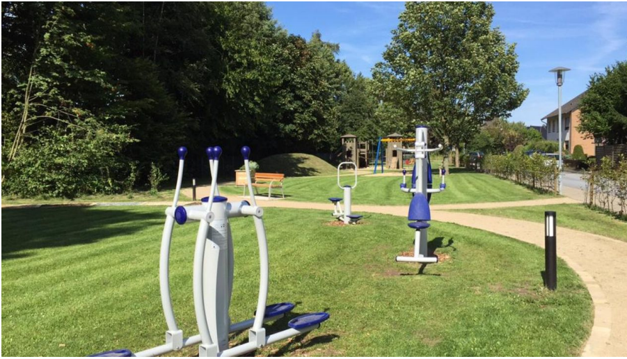
Generationenpark am Vogelgitter