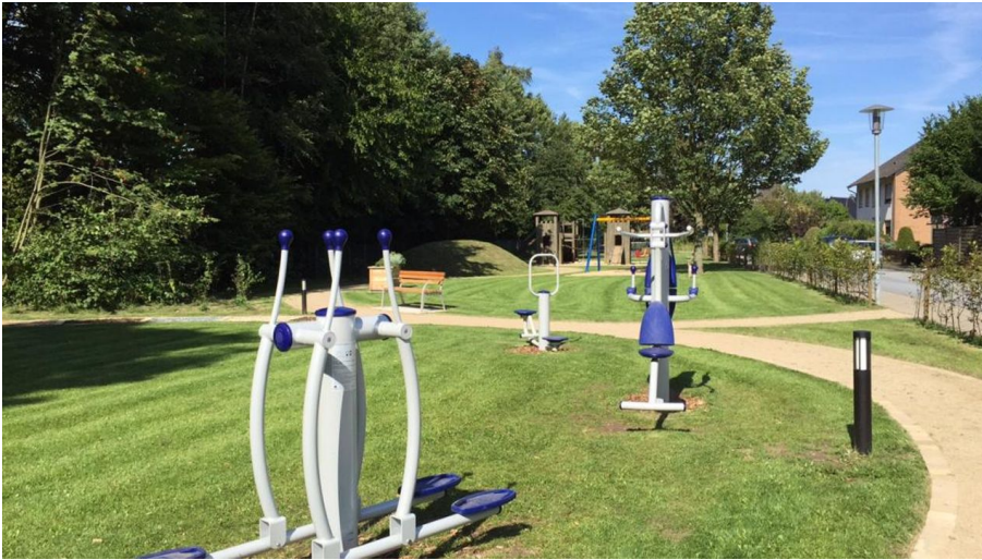
Generationenpark am Vogelgitter