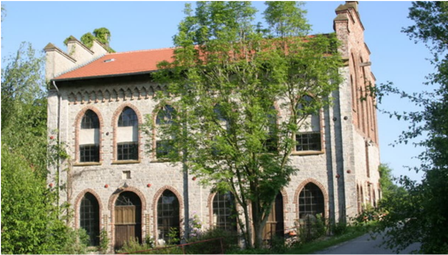
Brincker Mühle