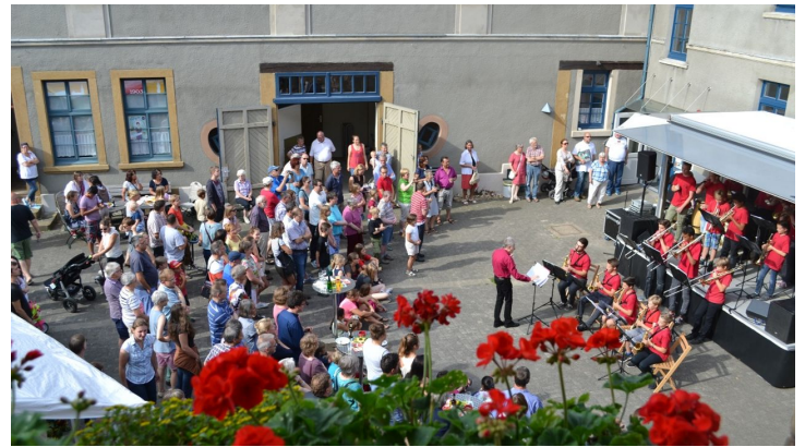
Veranstaltung im Innenhof des HAUSES WERTHER