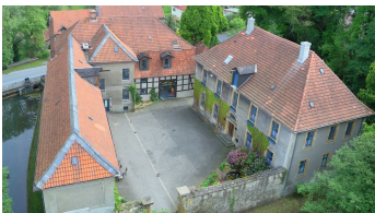
Luftaufnahme vom Schloß "HAUS WERTHER"