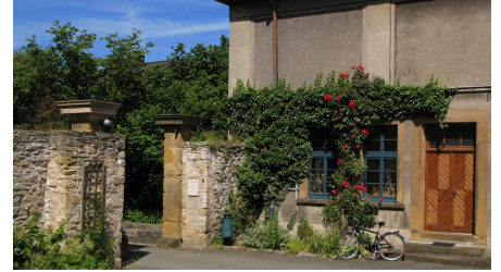
Innenhof im HAUS WERTHER