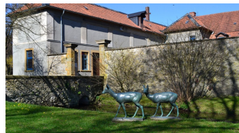
Rehe am Schloß "HAUS WERTHER"