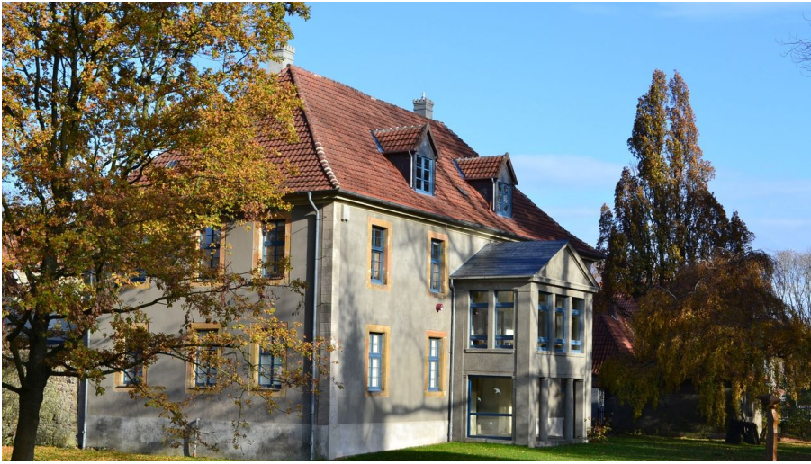
Schloß "HAUS WERTHER"