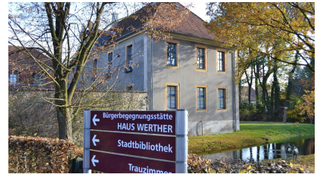
Eingangsbereich am "HAUS WERTHER"