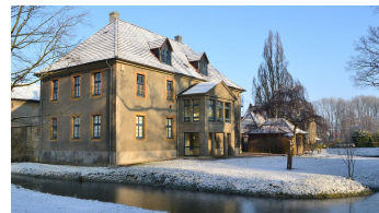
Bürgerbegegnungsstätte Haus Werther