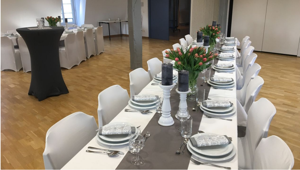
Festliche Dekoration im großen Saal im HAUS WERTHER