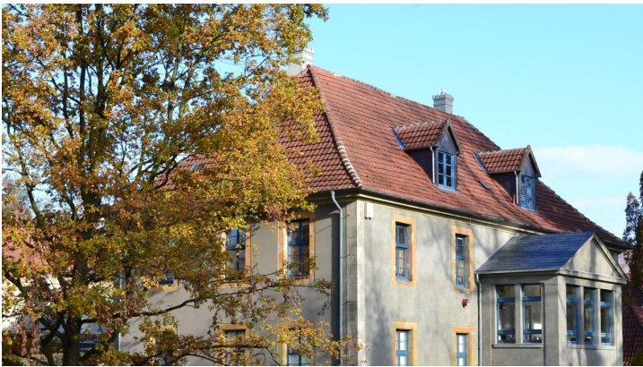
Schloß "HAUS WERTHER"