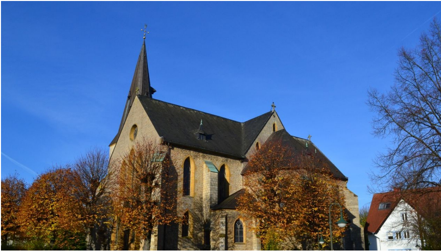
Ev. luth. St. Jacobi Kirche in Werther (Westf.) - © Stadt Werther