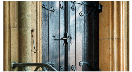
Eingangstür St. Jacobi Kirche in Werther