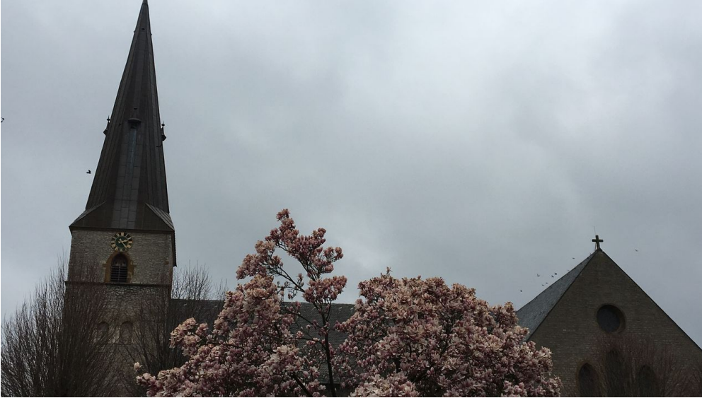
Magnolienblüte an der St. Jacobi Kirche in Werther (Westf.)