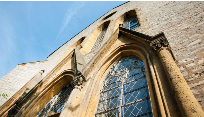
Ev. luth. St. Jacobi Kirche in Werther