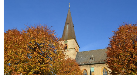
Ev. luth. St. Jacobi Kirche in Werther (Westf.)