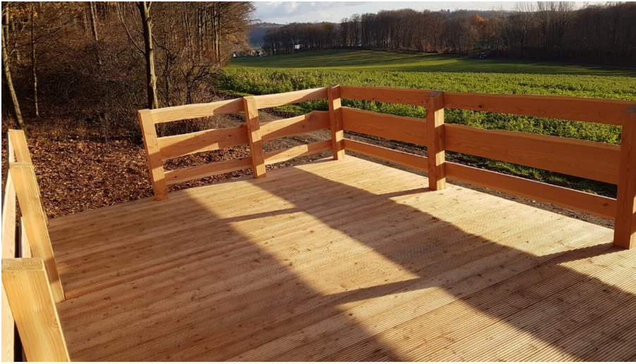
Rastplatz am Luisenturm Weg - © Tamara Kisker, Stadt Borgholzhausen