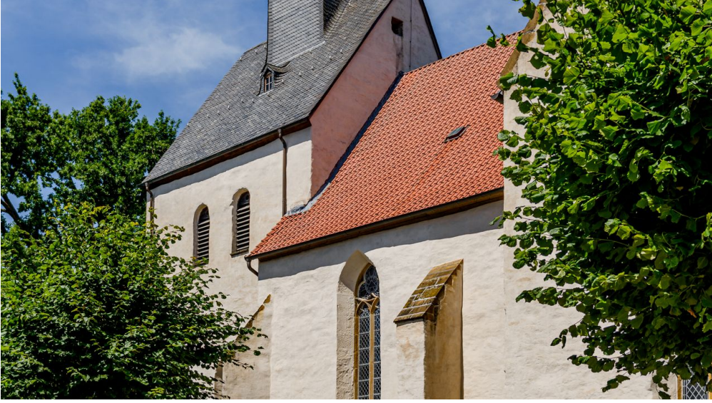
_BBB7210.jpeg - © Mario Wallenfang Fotografie