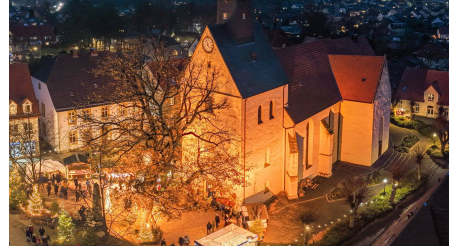
2022-12-03 Weihnachtsmarkt Borgholzhausen-8.JPG