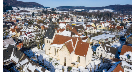
2021-02-14 Winter in Borgholzhausen-58.JPG