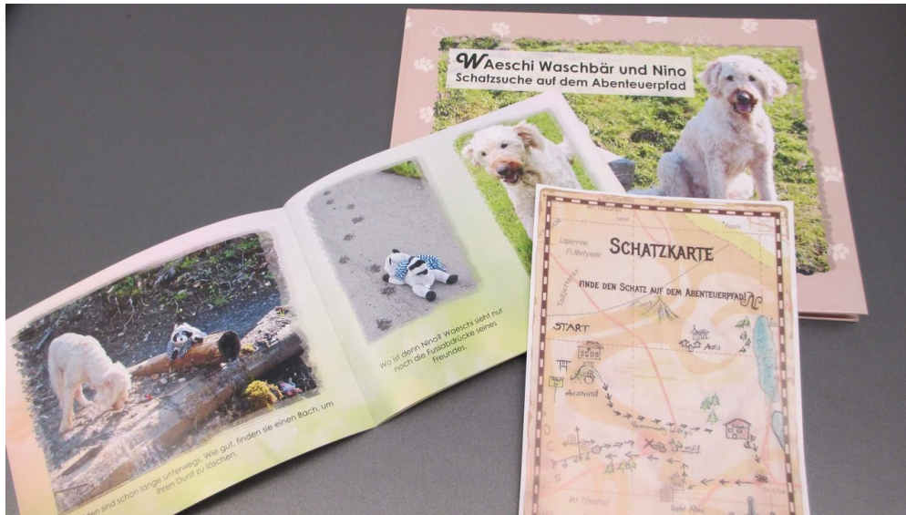
aeschi-waeschi-weg-schatzkarte