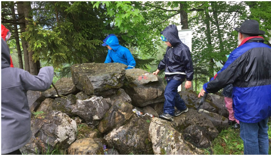
aeschi-waeschi-weg-regen-sommer-abenteuer