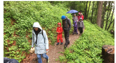
aeschi-waeschi-weg-schatzsuche-sommer-kinder