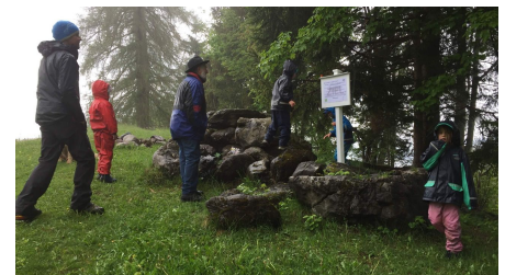
aeschi-waeschi-weg-waelder-regen-sommer-abenteuer