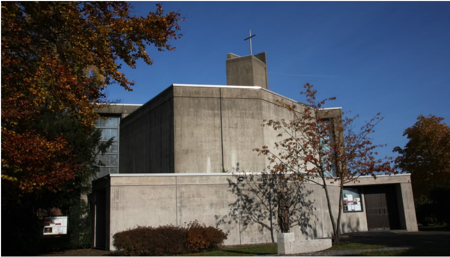
Katholische Kirche