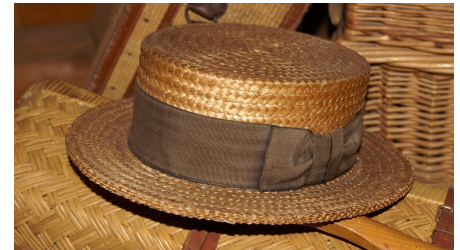
Flechtmuseum Thun