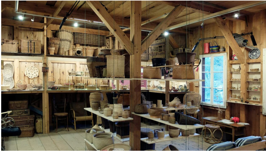
Flechtmuseum Thun