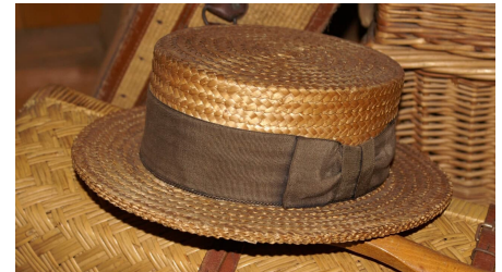
Flechtmuseum Thun