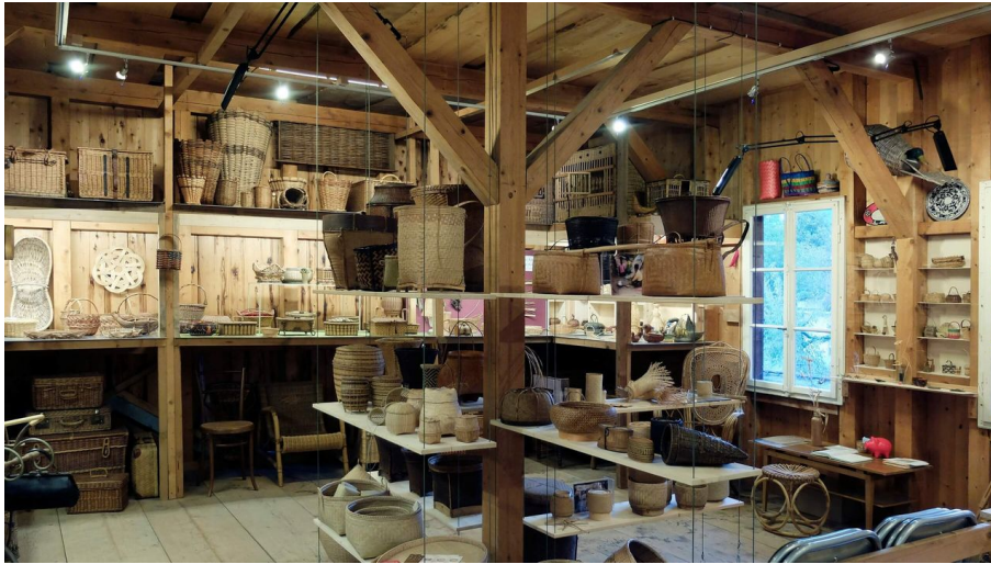
Flechtmuseum Thun