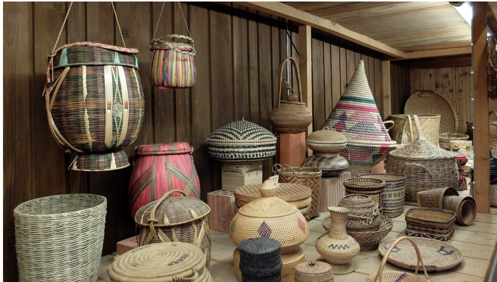
Flechtmuseum Thun, Interlaken Tourismus - web@interlakentourismus.ch

_____ Avril – octobre tous les 4 week-ends de 13h00 – 17h00 Sur rendez-vous, le musée et l'atelier de tissage peuvent être visités en dehors des heures d'ouverture officielles.