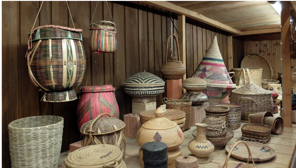
Flechtmuseum Thun, Interlaken Tourismus - web@interlaketourismus.ch

_____ Avril – octobre tous les 4 week-ends de 13h00 – 17h00 Sur rendez-vous, le musée et l'atelier de tissage peuvent être visités en dehors des heures d'ouverture officielles.