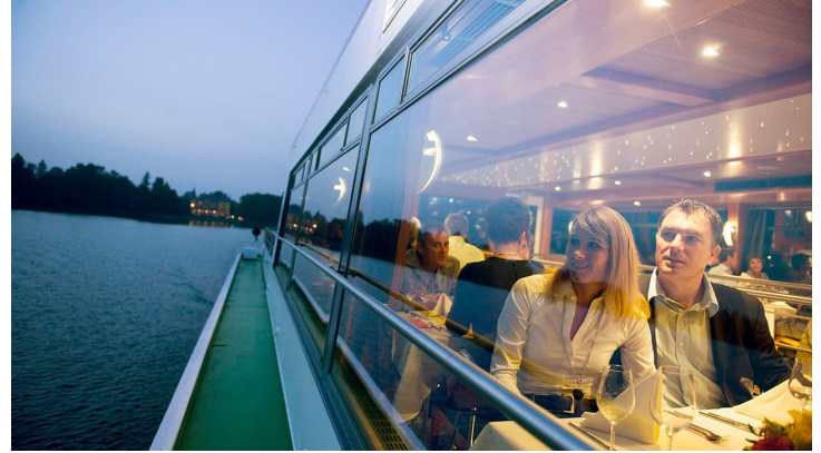
thunersee-bls-schiffahrt-schloss-restaurant