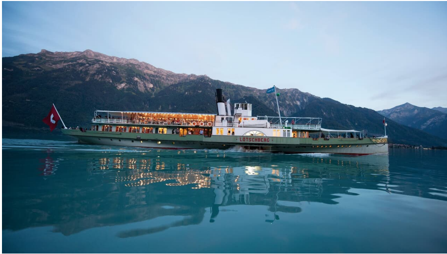
brienzersee-schifffahrt-sommer-loetschberg-dampfschiff-abend

Schifffahrt | Seen | barrierefrei | Sommer | Winter