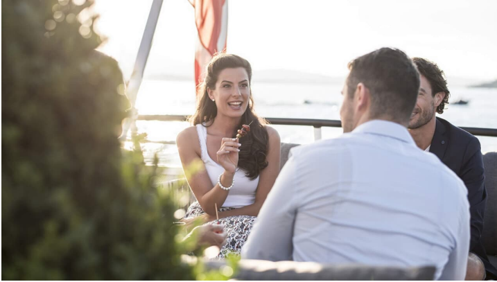
thunersee-bls-schiffahrt-kulinarik-verpflegung-sommer