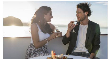
thunersee-bls-schiffahrt-sommer