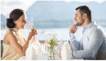
thunersee-bls-schiffahrt-dinner-sommer