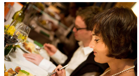
thunersee-bls-schiffahrt-essen-restaurant