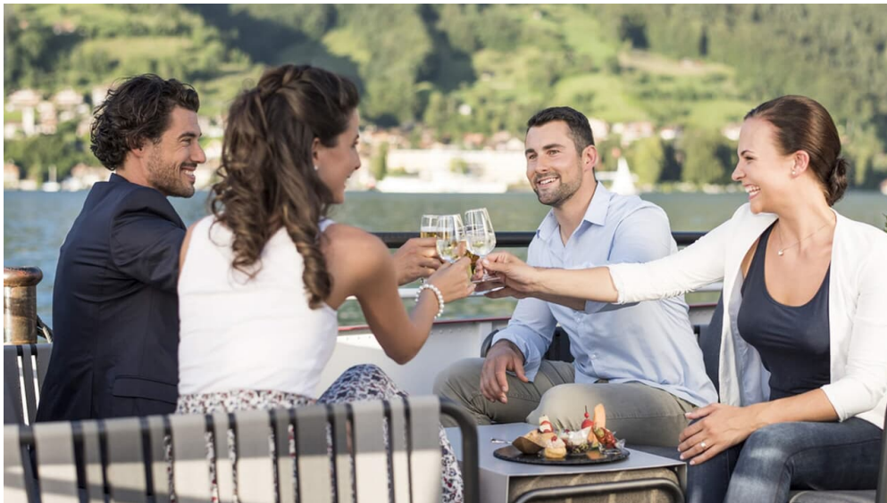
thunersee-bls-schiffahrt-essen-geselligkeit - - web@interlaketourism.ch