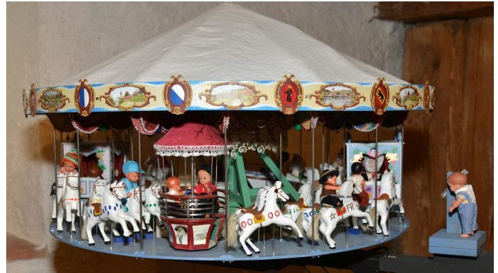
oberhofen-museum-uhren-mechanische-musikinstrumente