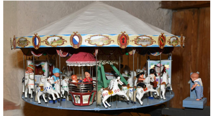
oberhofen-museum-uhren-mechanische-musikinstrumente