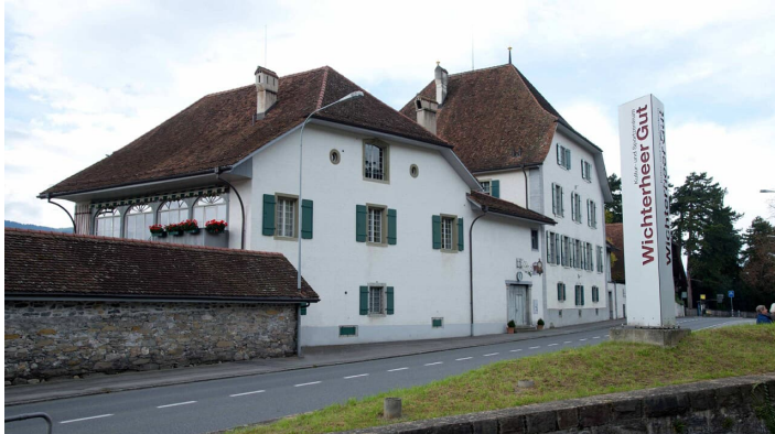
wichterheergut-museum-fuer-uhren.jpg

_____ Anfang Mai – Ende Oktober Dienstag bis Sonntag 14.00 – 17.00 Uhr