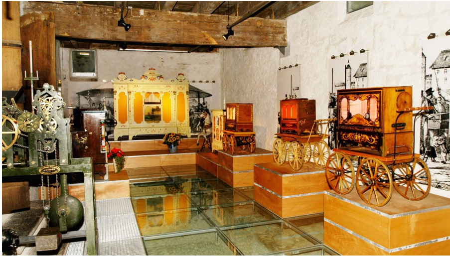
oberhofen-museum-fuer-uhren-und-mechanische-musikinstrumente