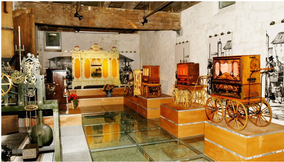
oberhofen-museum-fuer-uhren-und-mechanische-musikinstrumente