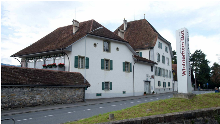
wichterheergut-museum-fuer-uhren.jpg

_____ Anfang Mai – Ende Oktober Dienstag bis Sonntag 14.00 – 17.00 Uhr