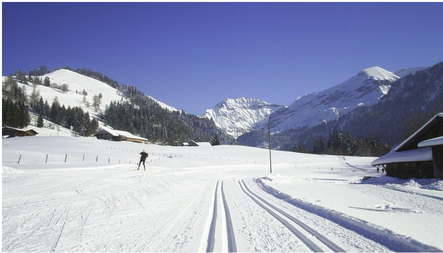
aeschi-langlauf-loipe-suldtal-winter-sport