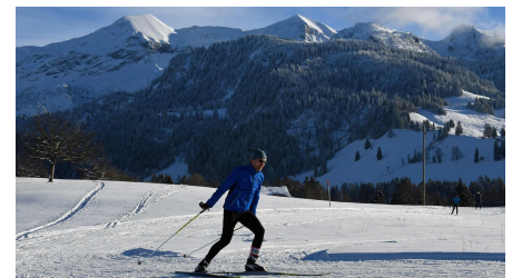
langlaufloipe-aeschiried-winter-berge-schnee-langlaeuer.jpg