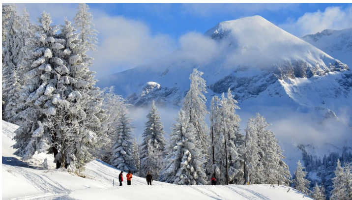
aeschi-wandern-winter-wald-gruppe