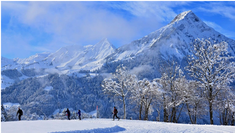
aeschi-langlauf-loipe-winter-panorama

Dezember – März, abhängig von der Schneelage