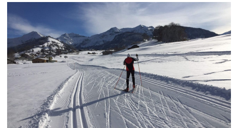
aeschi-langlauf-loipe-suldtal-winter-winteraktivitaet