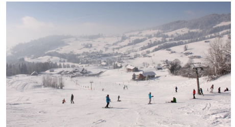
schwanden-bei-sigriswil-skillift-winter-skigebiet