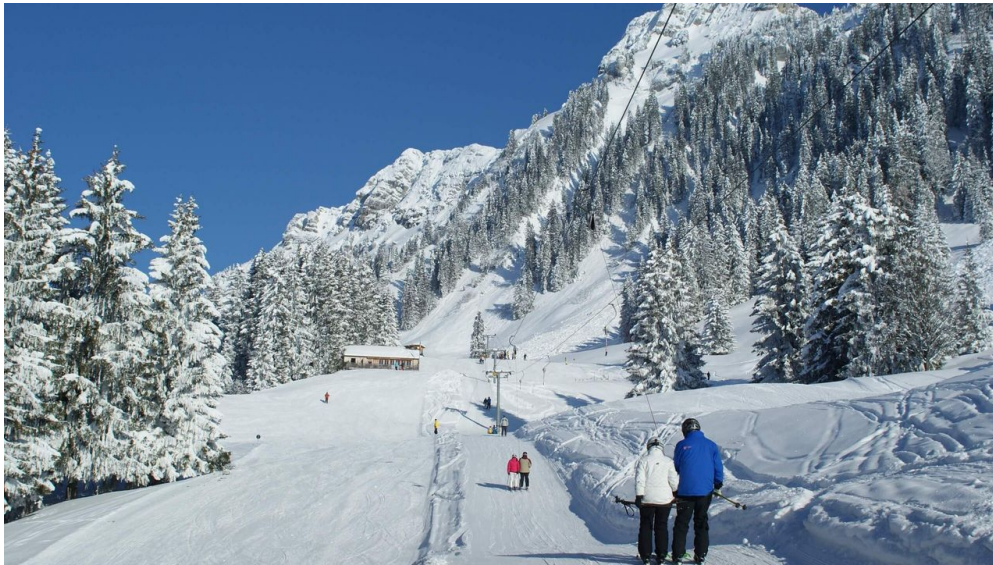
schwanden-bei-sigriswil-winter-schnee-skigebiet