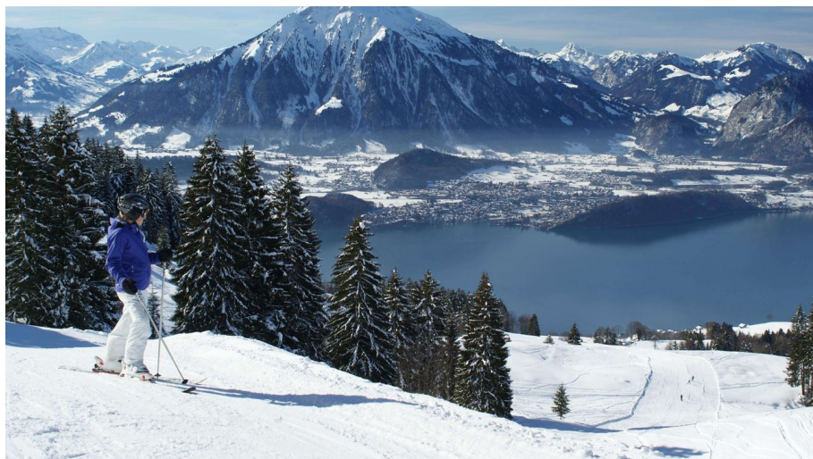
schwanden-bei-sigriswil-skigebiet-winter-niesen