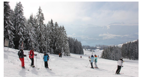
schwanden-bei-sigriswil-skillift-skigebiet-winter