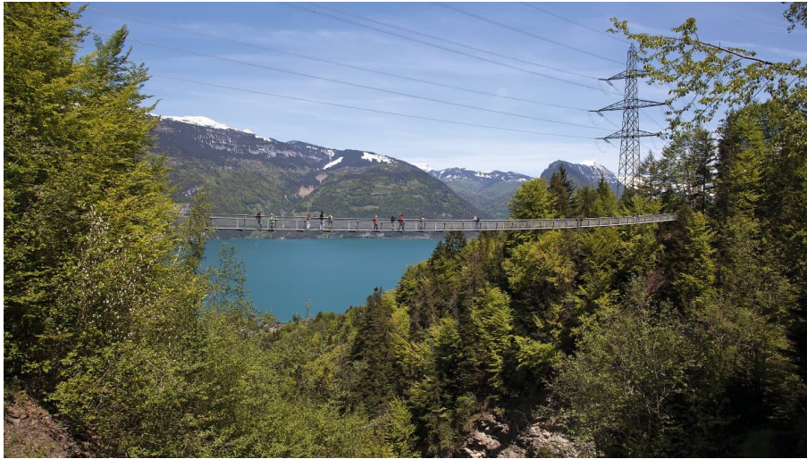
Interlaken Tourismus - web@interlaketourism.ch