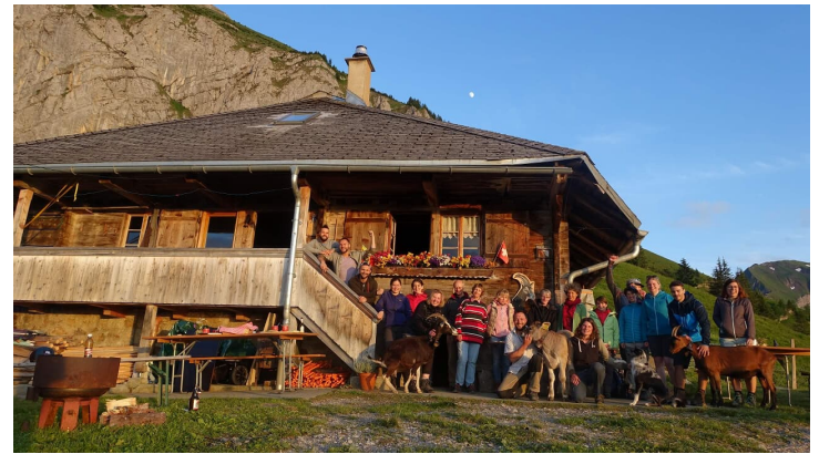
Aeschi Tourismus, Interlaken Tourismus - web@interlaketourism.ch