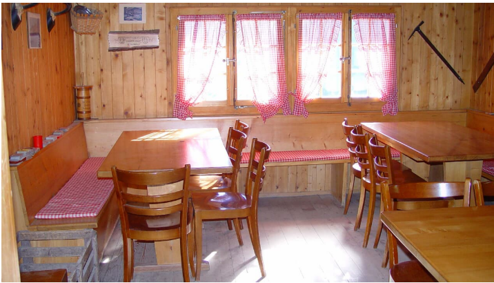
Aeschi Tourismus, Interlaken Tourismus - web@interlaketourism.ch