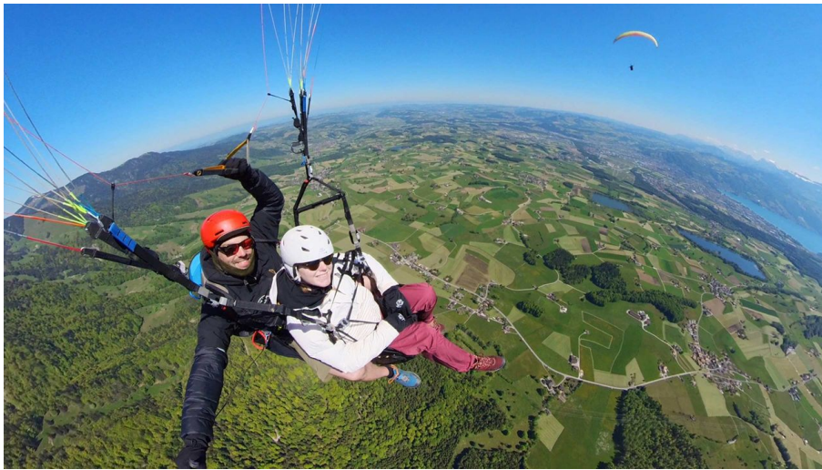
timetofly-tandem-paragliding-flug.jpg