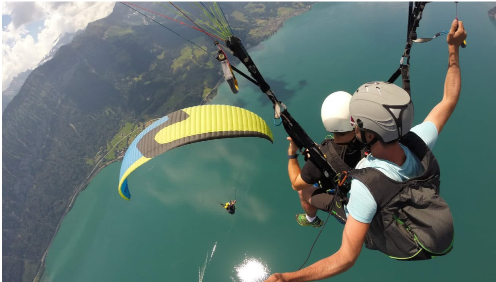
interlaken-twin-paragliding-seen-panorama