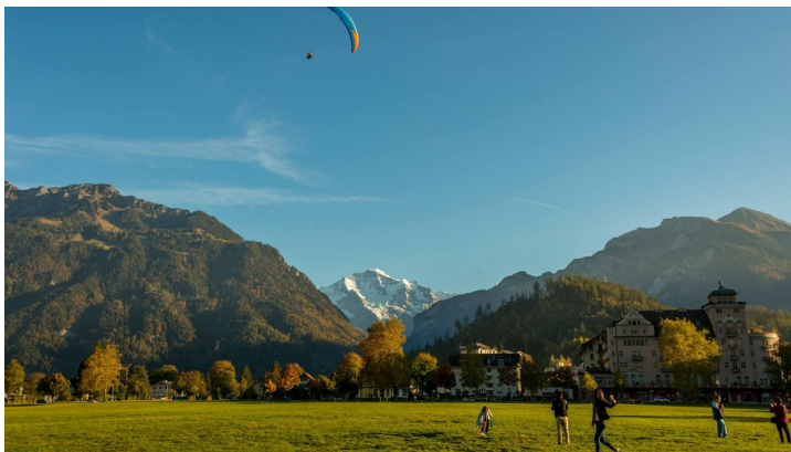
interlaken-twin-paragliding-jungfrau-berge-sommer