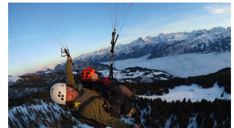
interlaken-twin-paragliding-winter-fliegen