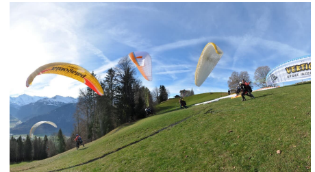
interlaken-twin-paragliding-sommer-fliegen