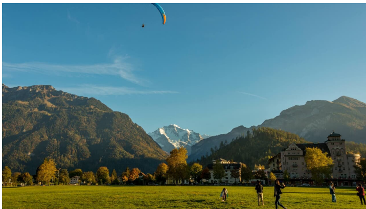
interlaken-twin-paragliding-jungfrau-berge-sommer