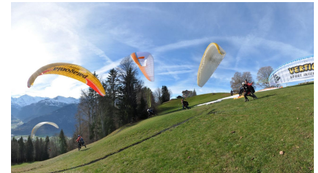
interlaken-twin-paragliding-sommer-fliegen