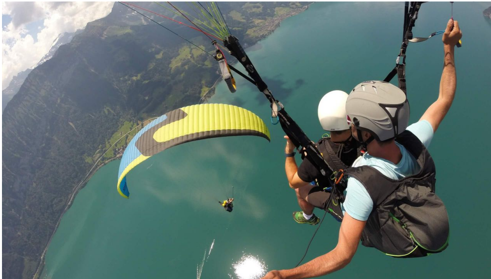
interlaken-twin-paragliding-seen-panorama