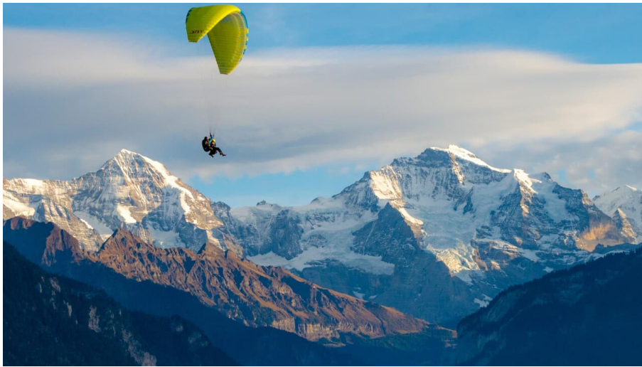
interlaken-twin-paragliding-berge-panorama-winter