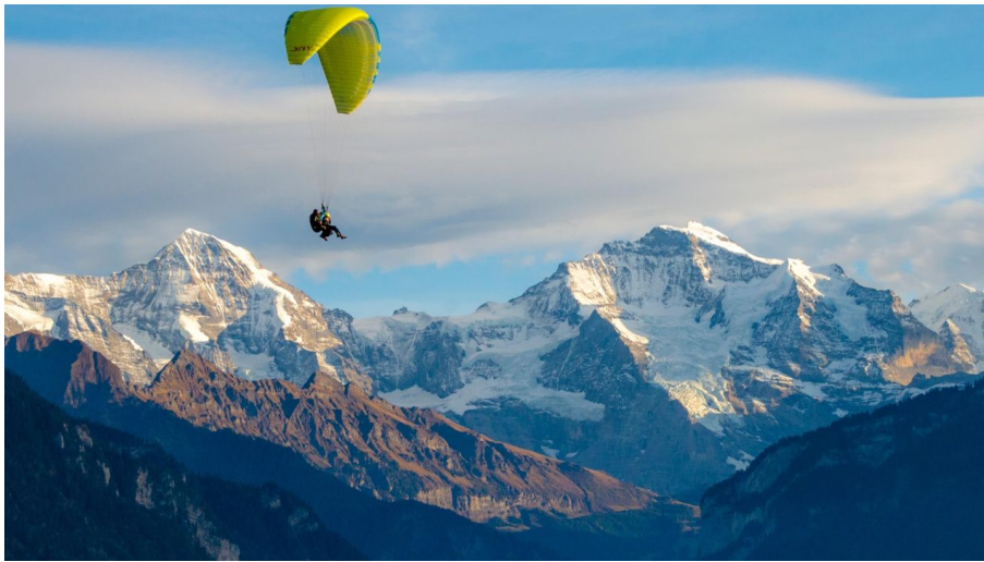
interlaken-twin-paragliding-berge-panorama-winter