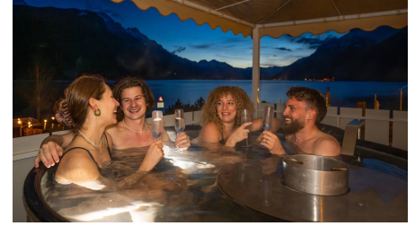
hotpot-brienz-gruppe-abend-aussicht.jpg