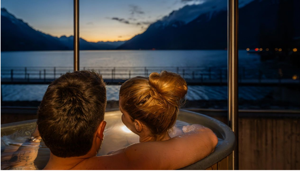
hotpot-brienz-paar-aussicht-abend.jpg