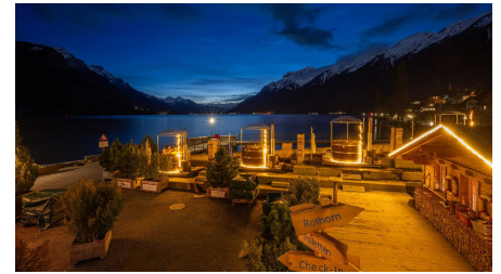
hotpot-brienz-lage-see-aussicht.jpg