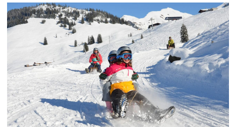
Naturpark Diemtigtal