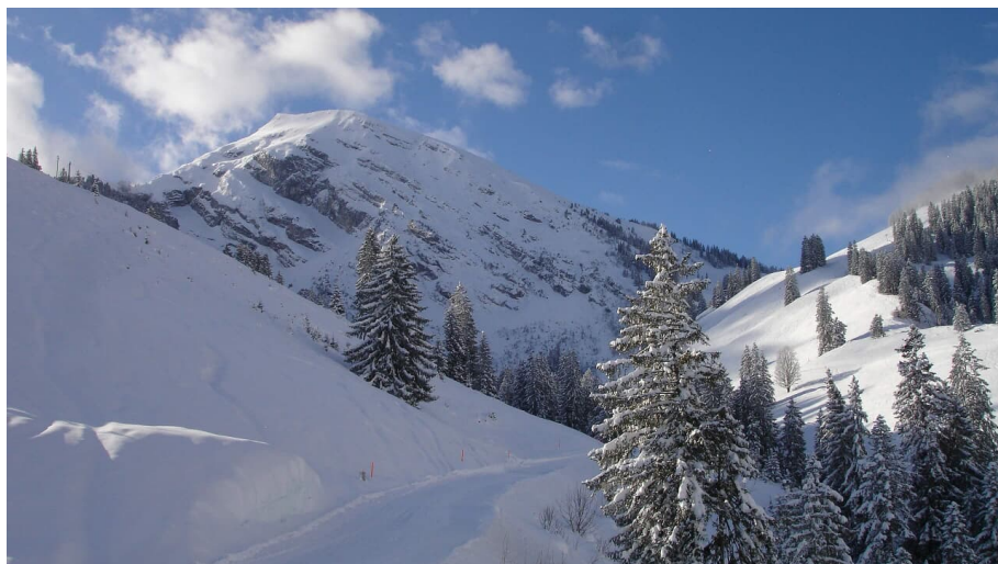
Naturpark Diemtigtal