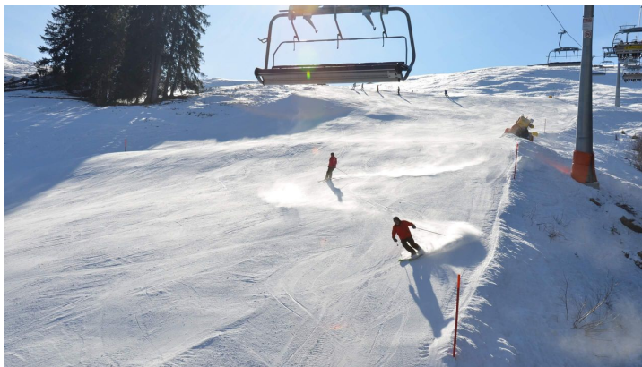
Naturpark Diemtigtal, Interlaken Tourismus - web@interlaktourism.ch