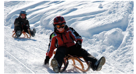
Naturpark Diemtigtal, Interlaken Tourismus - web@interlaktourism.ch