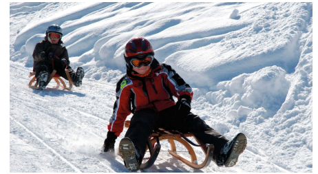
Naturpark Diemtigtal