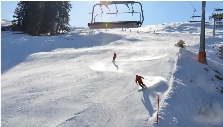
Naturpark Diemtigtal, Interlaken Tourismus - web@interlaktourism.ch