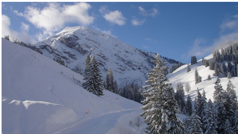
Naturpark Diemtigtal, Interlaken Tourismus - web@interlaktourism.ch