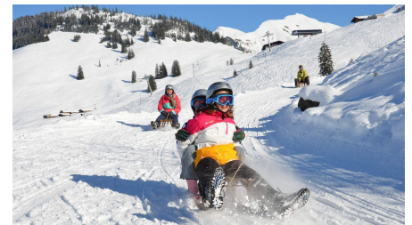
Naturpark Diemtigtal