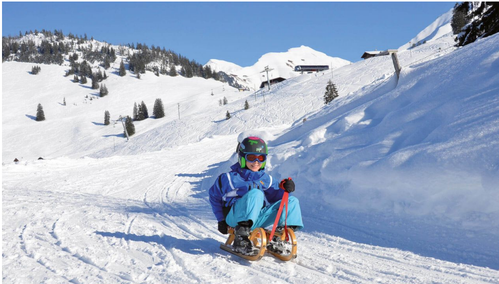
Naturpark Diemtigtal, Interlaken Tourismus - web@interlaktourism.ch

Pendant la saison de ski, tous les jours de 9 à 18h