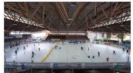
thun-kunsteisbahn-grabengut-eislaufen-winter