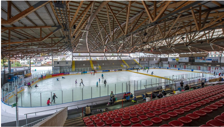
thun-kunsteisbahn-eislaufen-winter-winteraktivtaet