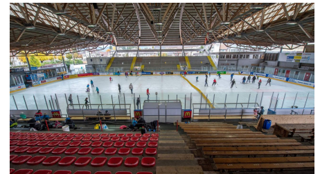
thun-kunsteisbahn-eislaufen-winter