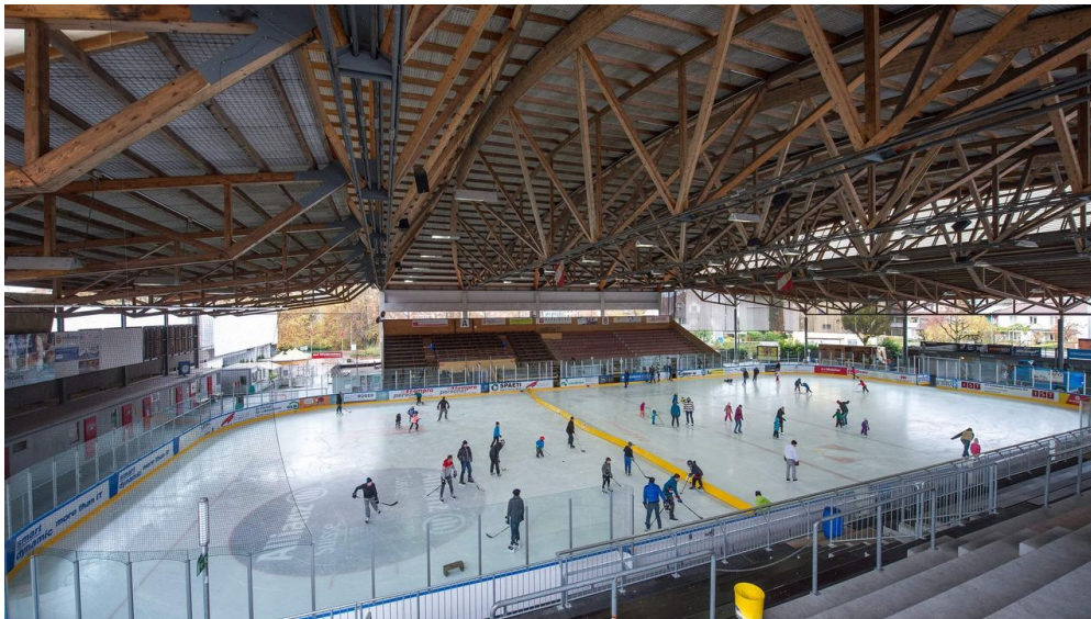
thun-kunsteisbahn-grabengut-eislaufen-wintersport-winter