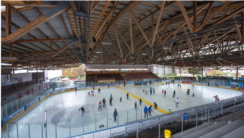
Kunsteisbahn Thun