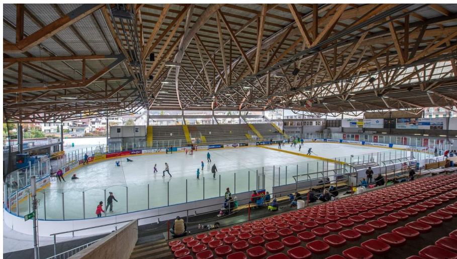
Kunsteisbahn Thun