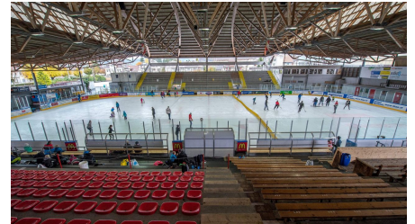
Kunsteisbahn Thun