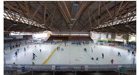
Kunsteisbahn Thun