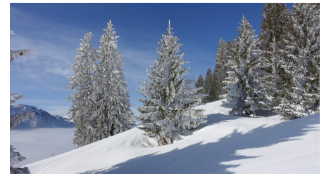
diemtital-schneeschuhwandern-winter-unterhalb-vorderstockenalp-erlenbach