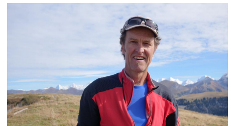
diemtital-schneeschuhtouren-kammer-ueli-winter-winteraktivitaet