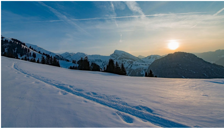
dientigtal-schneeschuhtouren-kammer-ueli-winter-sonnenschein