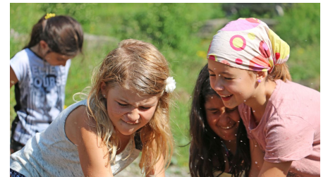
Spielen mit dem kostbaren Nass