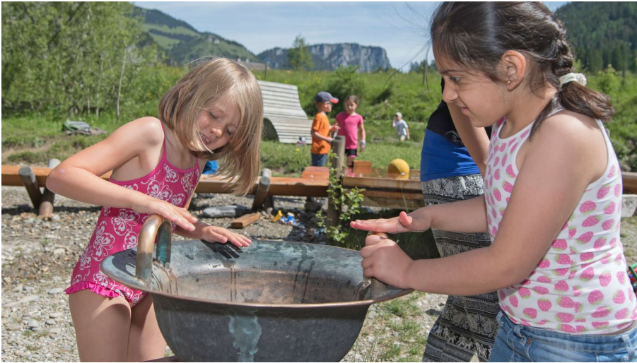
Vielfältiges Spielvergnügen auf dem Wasserspielplatz