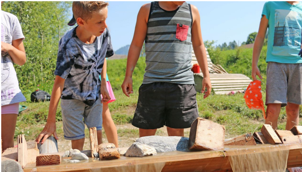
Wie wirkt sich das Stauen der Känel aus? - © Naturpark Diemtigtal

Tagesmiete Fr. 50 inkl. Unterlagen zur Vorbereitung sowie Material für die Aktivitäten und Spiele