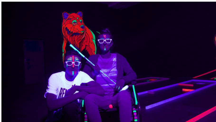
wilderswil-omega-next-level-indoor-minigolf-anlage-farben-neon

Nachtleben | Minigolf | barrierefrei | Sommer | Winter