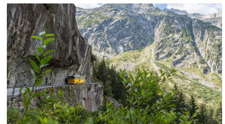
postauto-paessefahrten-zentralalpen-herbst-copyright-postauto