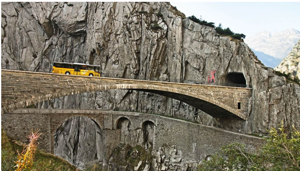
postauto-paessefahrten-felsen-zentralalpen-copyright-postauto