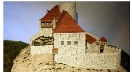
dorfmuseum-wilderswil-modell-ruine-unsponnen