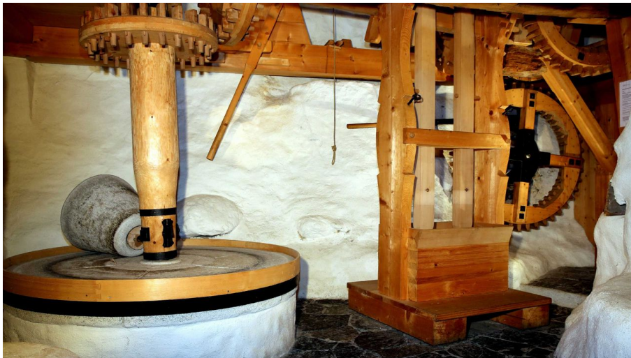
wilderswil-alte-muehle-raederwerk-muehle-innenansicht