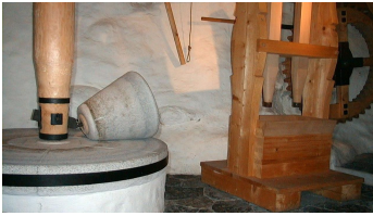
wilderswil-alte-muehle-innenansicht