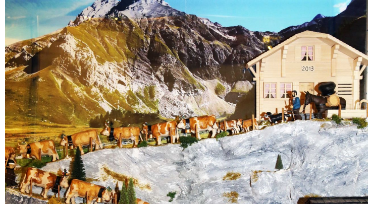
dorfmuseum-wilderwil-alpendiorama-alpabzug