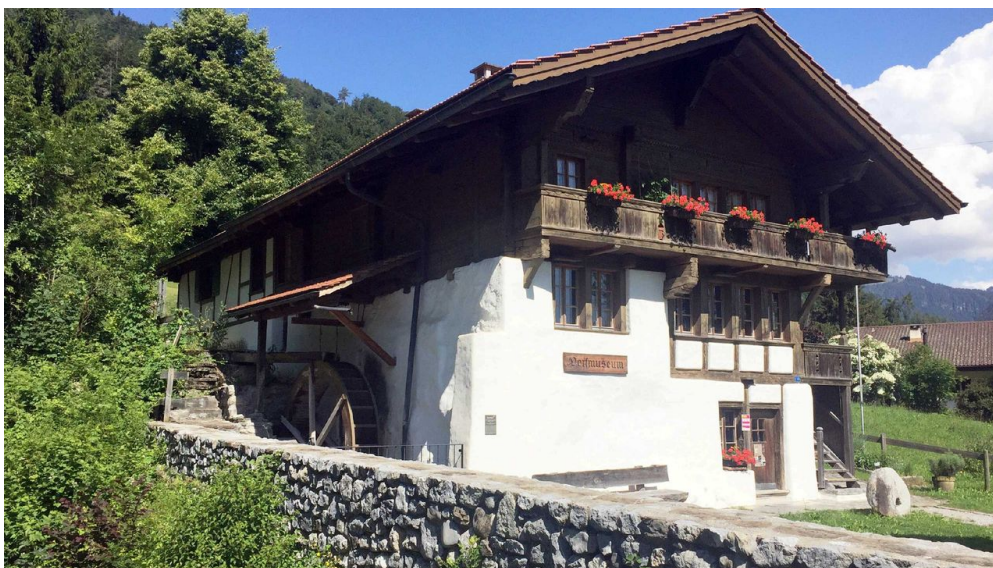
wilderswil-alte-muehle-sommer-gebäude-aussenansicht