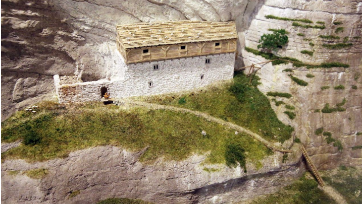
dorfmuseum-wilderwil-modell-ruine-rotenfluh