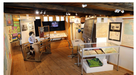
dorfmuseum-alte-muehle-wilderswil-ausstellung-alte-schulstube.jpg