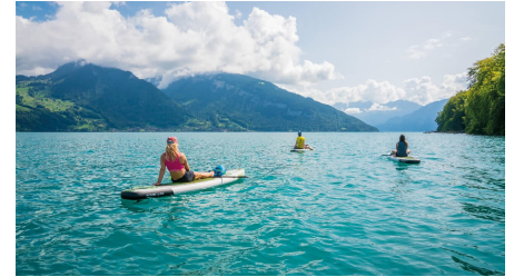
Spiez Marketing AG, Interlaken Tourismus - web@interlaktourismus.ch