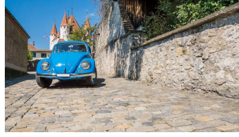
grand-tour-of-switzerland-thun-stadt-auto-sommer