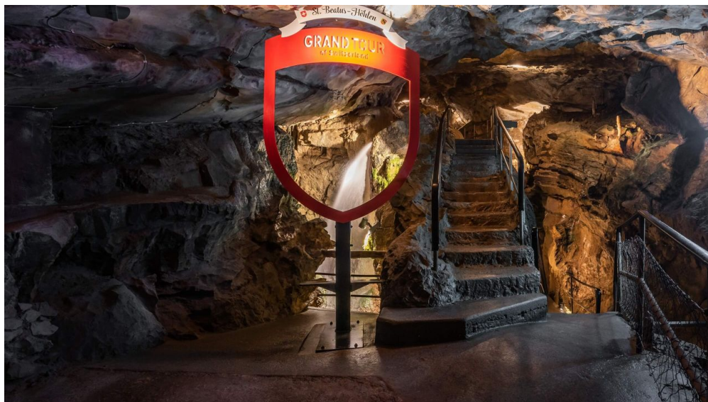
st-beatus-hoehlen-grand-tour-of-switzerland-sommer-beleuchtung