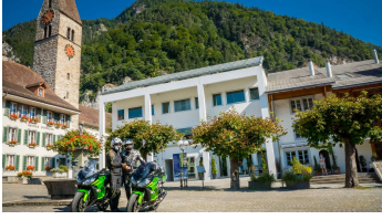
grand-tour-of-switzerland-thun-motorrad-fahren-sommer