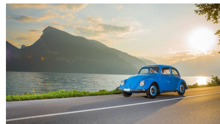
grand-tour-of-switzerland-sommer-thunersee