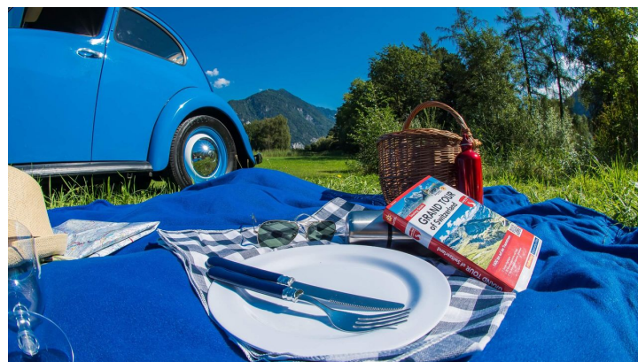
grand-tour-of-switzerland-pick-nick-stadtplan-sommer