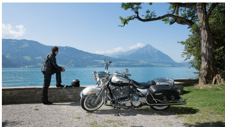
grand-tour-of-switzerland-motorrad-thunersee