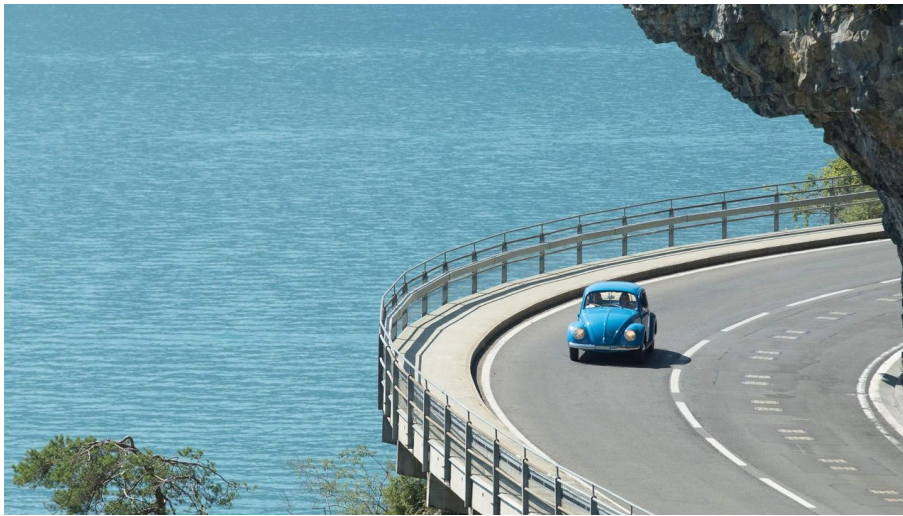
grand-tour-of-switzerland-thunersee-strasse